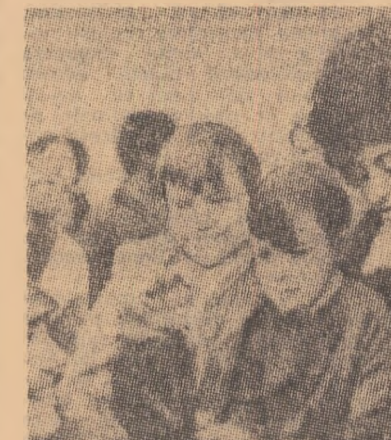
Un membru al delegației U.R.S.S. la Geneva.

Un purtător de cuvînt oficial al delegației americane a declarat că, în timpul discuțiilor s-au desășurat într-o atmosferă de lucru, cordată. El a arătat, de asemenea, că, spre deosebire de înfăptuirea precedentă, la actuala rundă se va trece înca de la început la formarea unor grupuri de lucru pentru examinarea anumitor probleme concrete. La sesiunea în capitala finlandeză, șeful celor două delegații au făcut scurte declarații. Avem instrucțiuni ferme din partea guvernului sovietic, a spus Vladimir Semionov, că discuțiile vor fi într-un spirit de lucru și constructiv. Delegația U.R.S.S. este gata să depună toate eforturile corespunzătoare.