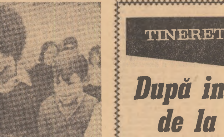
Un membru al delegației U.R.S.S. la Geneva.