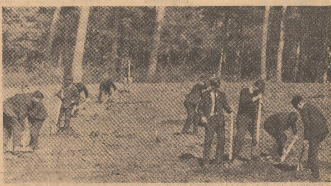
Ploesti. Unul din secile de puncte ale județului Prahova unde tinerii au ținut în număr mare pentru a participa la campania de împăduriri.