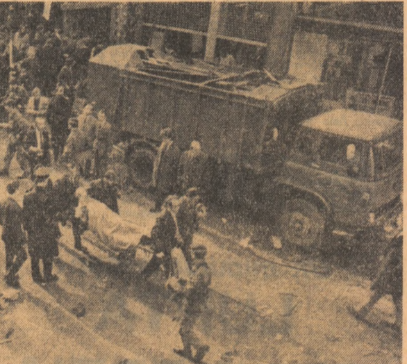
IRLANDA DE NORD. — Aspect din timpul unor recente incidente care s-au produs la Belfast