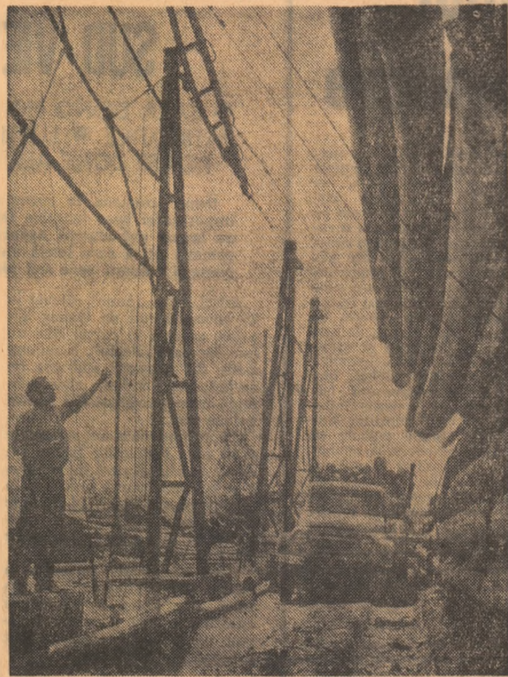
La U.E.L.L. Toplița, pădurea își trimite ofranda pe timpul primăverii