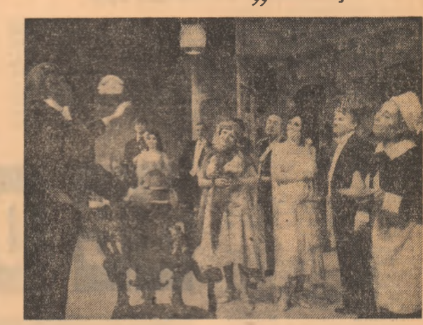
Scenă din spectacolul „...Escu“ la Teatrul Giulești