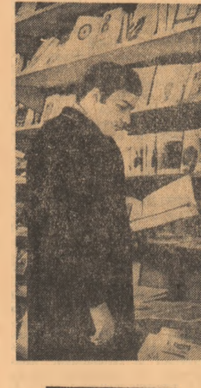
Nu-i ușoară alegerea...