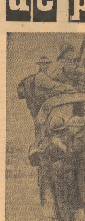
VIETNAMUL DE SUD. — Mercenarii saigonezi părăsind în derută una din bazele lor din nord în fața ofensivei recente a forțelor patriotice