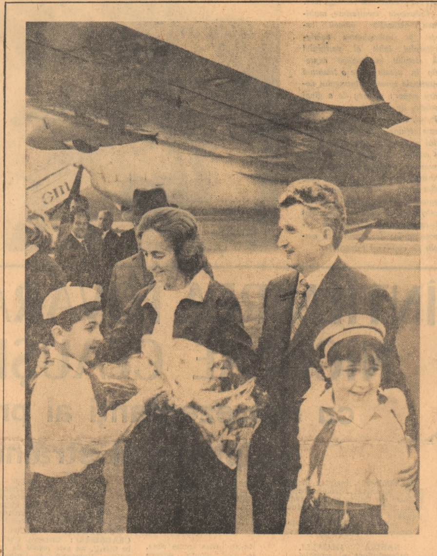
Întîlnirea la aeroportul Băneasa a tovarășului Nicolae Ceaușescu și a soției sale, Elenă Ceaușescu, de către copii și oficialii aeroportului.

Ați urmărit și cunoașteți din relatările presei, televiziunii și radioului modul cum s-au desfășurat întîlnirile, precum și