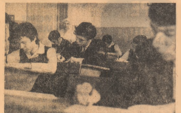
Fotoreporterul nostru a surprins un aspect de la Liceul „Mihai Viteazul” — București, unde se desfășoară faza republicană a Olimpiadei de română