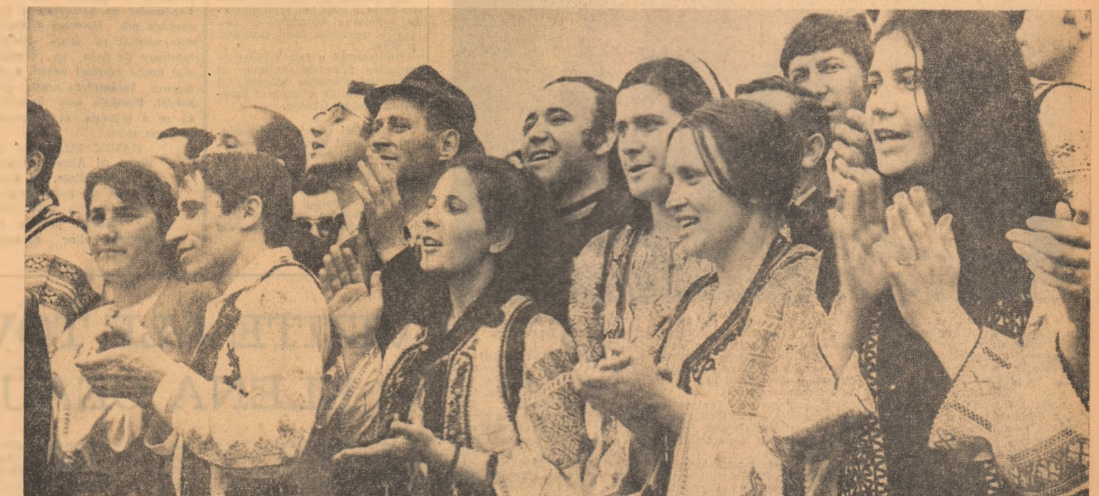
Din inimă, un bun venit, conducătorului iubit al partidului și statului