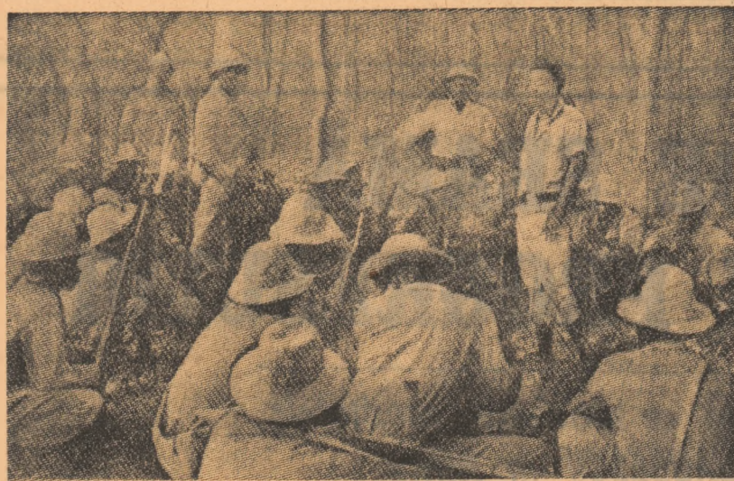
GUINEEA (BISSAU). — O unitate a forțelor armate populare de eliberare

Operațiunile de salvare se desfășoară în condiții extrem de dificile. După puternica mișcare seismică de luni au urmat succesiv peste 1.000 de alte cutremure de mai mică intensitate — relatează agenția iraniană de presă. Marti dimineață, agenția iraniană de presă afirma că în urma seismului și-au pierdut viața 5.000 de persoane, cea mai mare parte prînse sub dărâmturi.