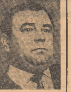
ȘTEFAN TRIȘPA: Legile, arcite de bune, nu au nici o valoare dacă nu sint aplicate și respectate. Doare tinerilor să fie cei mai de nădejde apărători ai legislației socialiste.