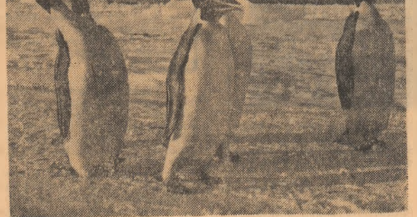
Prieteni apropiați la Mirnii

Să lămurim cititorului povestea cu această „vară”. Noțiunea de vară și iarnă polară este determinată numai în ceea ce privește lumina solară, nu și ca fenomen climatic. E drept, există și diferențe de tempera-