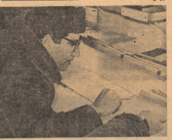
La tînaul Antarcticidei, în laboratorul de meteorologie al vasului de cercetări „Profesor Vize”; chiar și în aceste condiții, de încălzire încălzită, temperatura nu poate urca mai mult de 4 grade.