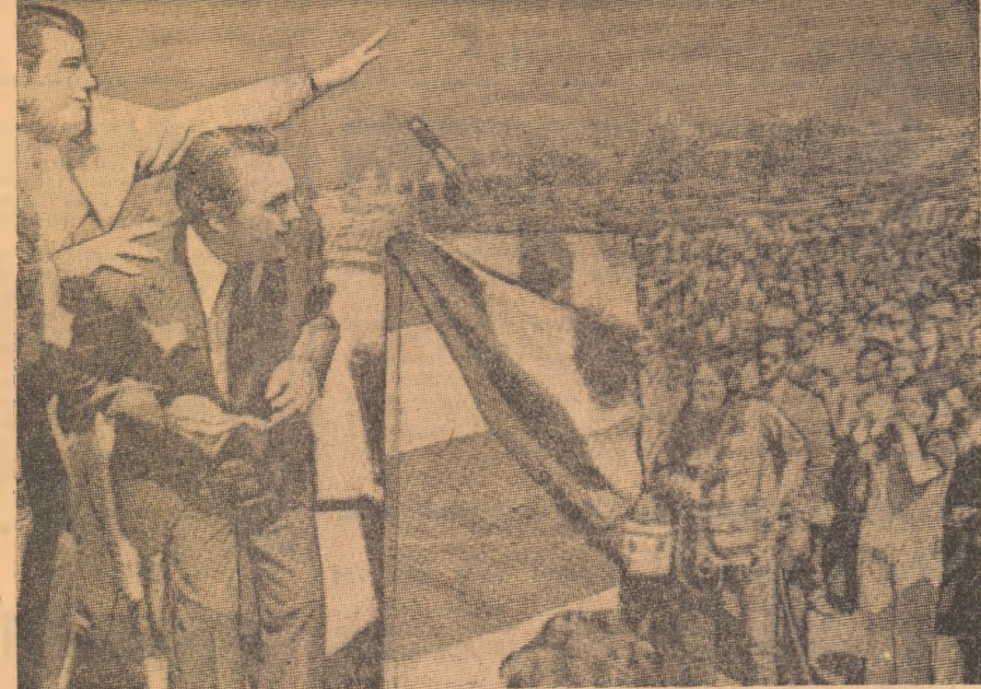
Guvernatorul George Wallace, cunoscut pentru vederile sale conservatoare, de dreapta, a fost nevoit să-și întrerupă o înfruntare electorală la Washington în fața avalanșei de proteste a alegătorilor.

LA 15 MAI, la Cairo, au avut loc convorbiri între mareșalul Andrei Greco, ministrul apărării al U.R.S.S., care face o vizită în R.A.E., și Hohamed Ahmed Sadek, vicepreședintele Consiliului de Miniștri, ministrul apărării al Republicii Arabe Egipt — anunță agenția TASS.