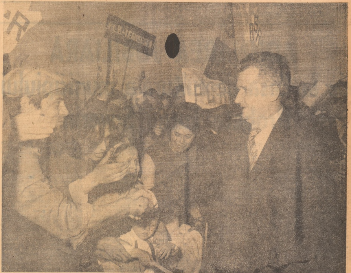
Populația orașului sărbătorită a făcut o primire entuziastă tovarășului Nicolae Ceaușescu, celorlalți conducători de partid și de stat.

leri, în prezența tovarășului Nicolae Ceaușescu, locuitorii din Drobeta Turnu Severin au sărbătorit 1850 de ani de existență a municipiului și 90 de ani de la înființarea Uzinei de vagoane