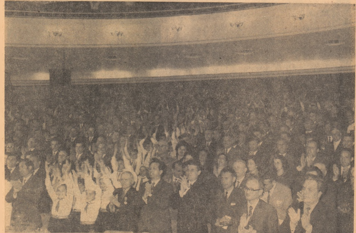
Adunarea jubiliară s-a desfășurat într-o atmosferă însuflețitoare. Participanții ovăionează îndelung pentru Partidul Comunist Român, pentru Comitetul său Central, pentru secretarul general al partidului, tovarășul Nicolae Ceaușescu.

Vă doresc tuturor multă sănătate și multă fîcrică! (Aplauze puternice, prelungite; se scandează îndelung „Ceaușescu—P.C.R.”, „Ceaușescu și poporul”); cei prezenți la miting ovăionează minute în sir pentru Partidul Comunist Român, pentru Comitetul său Central, pentru secretarul general al partidului, tovarășul Nicolae Ceaușescu).