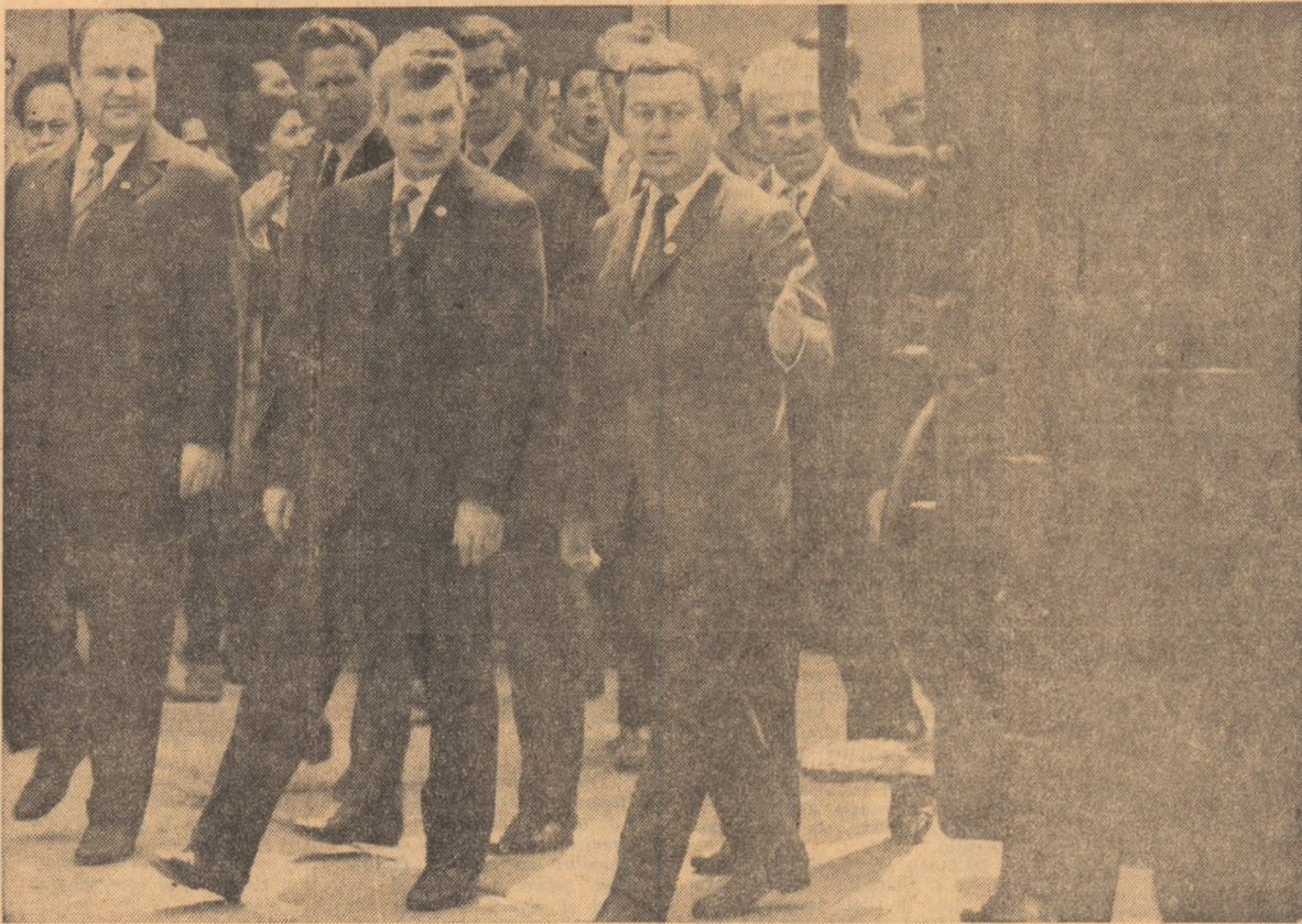
Ca întotdeauna și de astădată vizita secretarului general al partidului a căpătat un pronunțat caracter de lucru.

• Marea adunare populară — grandioasă manifestare a unității de nezdruincinat dintre partid și popor, a atașamentului profund față de politica internă și externă a țării noastre, a hotărârii de a da viață mărețului program de infaptuire a societății socialiste multilateral dezvoltate