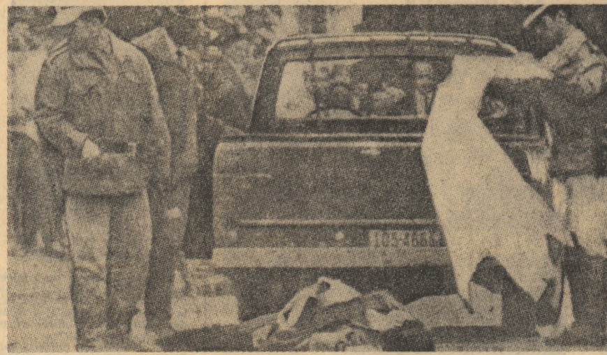
Tensiunea persistă în Uruguay. În fotografia noastră, aspect de la recente incidente sîngeroase din Montevideo

BERLIN 17. — Corespondentul Agerpres, Ștefan Deju, transmite: Corespondenții măsurilor adoptate de Biroul Politic al C.C. al P.S.U.G. și de Consiliul de Miniștri al R.D. Germane în februarie a.c., pentru a doua oară în acest an intră în vigoare temporar reglementări prevăzu-