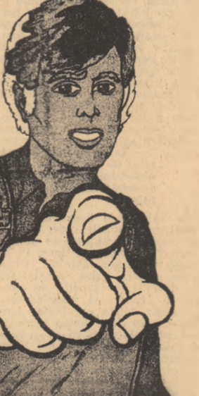
Coperta unui recent număr special din „Challenge” care rezumă alocvent revendicările tinerilor muncitori: „sluibe, să larii, instruire — acum!”

va lansării lor pe întreg teritoriul țării prezintă o nouă înconștientabilă. Astfel de secțiuni ale „Trade-Unionurilor” se înființează de la începutul anului conferințele. Cea de la 5 martie a.c. de la Sheffield, a evidențiat forța pe care ar putea s-o reprezinte aceste secțiuni pe plan național, pornindu-se de la exemplul oferit de existența a 69.000 de tineri între 18 și 24 de ani în industria de mașini. Ecoul stîrnit de această inițiativă în rîndul tineretului muncitor s-a concretizat în apariția unor secțiuni la Birmingham, în Midlands, Londra, toate convenind să pregătească conferințele regionale, ca o premisă la întreprinderea pasului următor — conferința națională a secțiunilor tineretului din Trade-Unionuri. Unificarea acțiunilor lor derivă dintr-o necesitate acută pe care o resimt tinerii — aceea de a-și aduce propriile probleme în discuție cu reprezentanții lor, de a vota hotărîri care-i interesează direct în procesul muncii și în relațiile cu patronii. Și chiar numărul impresionant al celor trei milioane de tineri care sînt în afara unor forme de organizare impune, de la sine, avansarea acestei inițiative.