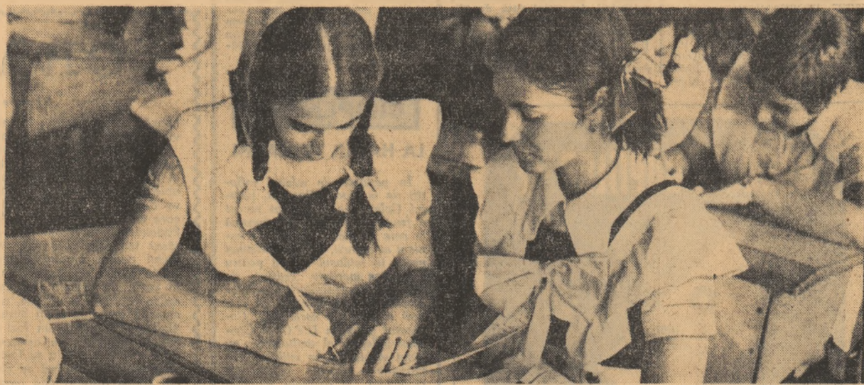
Tînuță specială pentru ultimele zile din viața de elev: uniforma din clasa întâi.