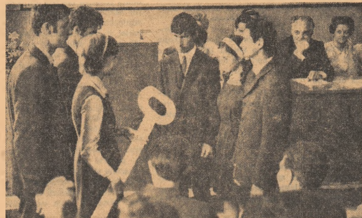
Cheia succeselor — simbolul activităților rodnice desfășurate în școală — este predată elevilor din anul III

CALIN STĂNCULESCU (Continuare în pag. a II-a)