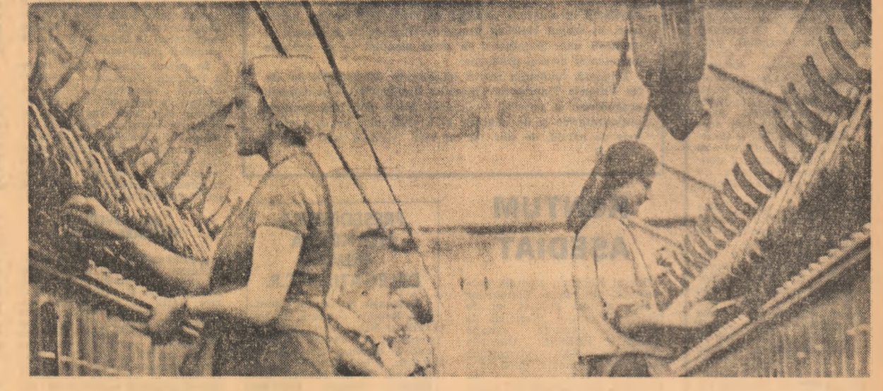
Aspect cotidian de muncă a colectivului Fabricii de prelucrare a lînii și cîneșii din Negrești, Satu Mare