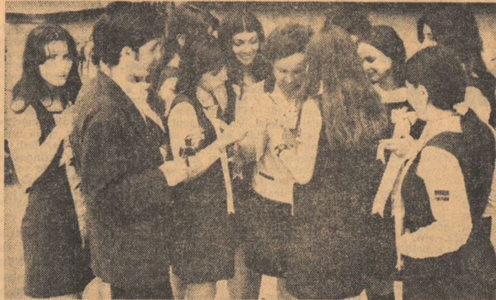
Un ultim autograf pe panglicile de rămas bun

„Cel aproape 80 000 de absolvenți ai liceelor teoretice și de specialitate au spus, ieri, școlii „bun rămas, îți mulțumim”. Clichetul sonor a răsunat pentru ultima oară auzind în atmosfera sărbătorii a festivității de rămas bun și o undă de nostalgie. În acest an am participat alături de cei 156 de absolvenți ai Liceului „Ion Neculce” din Capitală la manifestarea transformată într-o puternică tradiție, în cadrul căreia promovații a predat „Cheia succeselor” celor din anul III. Erau prezente în școlii elevii care timp de 12