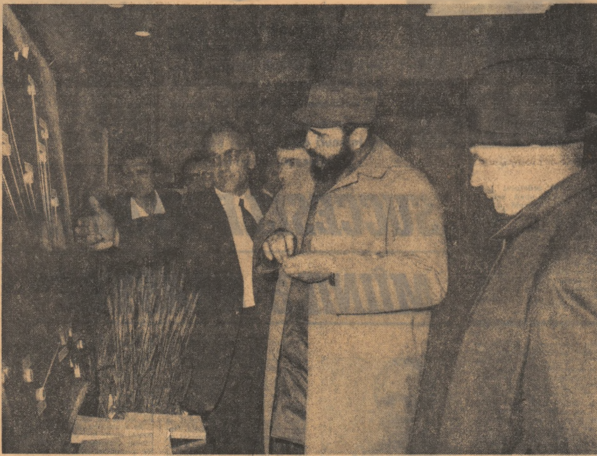
Rezultatele cercetării agricole românești s-au bucurat de aprecierile elogiante ale oaspeților

● Au fost vizitate I.A.S. „30 Decembrie” și Institutul de cercetări pentru cereale și plante tehnice — Fundulea