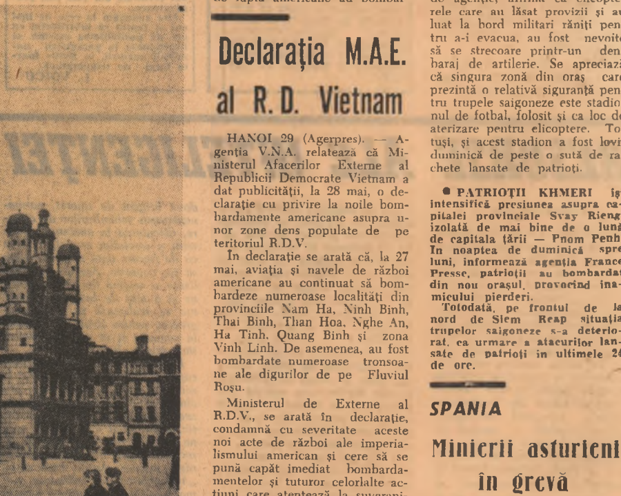
R.P. POLONA: Imagine din orașul Opole

Maxim Berghianu la Belgrad LUNI A SOSIT LA BELGRAD Maxim Berghianu, președintele Comitetului de Stat al Planificării din România. Pe aeroportul din Belgrad, oaspetele român a fost întâmpinat de Borislav Iovici, directorul general al Institutului federal de planificare economică din R.S.F. Iugoslavia. De alți reprezentanți ai conducerii Institutului de funcționari superiori din Secretariatul Federal pentru Afacerile Externe. A fost prezent ambasadorul român la Belgrad, Vasile Sandru. În cursul după-amiezii, au început convorbiri între conducătorii celor două organe centrale de planificare cu privire la dezvoltarea colaborării economice, cooperării în producție și schimburi de mărfuri dintre cele două țări.