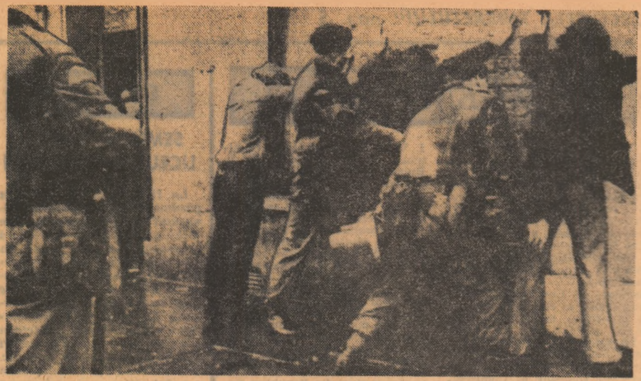
IRLANDA DE NORD: O scenă a devenit familiară la Belfast: cetățenii sînt nevoiți să se pună tot mai des contraoalele corporale ale poliției și armatei.