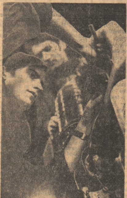
„Putem spune că muncim într-o secție a tineretului”

Și cine ar putea să ne sintetizeze mai exact dimensiunile prezente și în perspectivă ale activității de creație, de autoturare, decît tovarășul Lucian Cazacu, inginer șef cu concepția, el însuși avînd o extrem de valoroasă contribuție în acest compartiment.