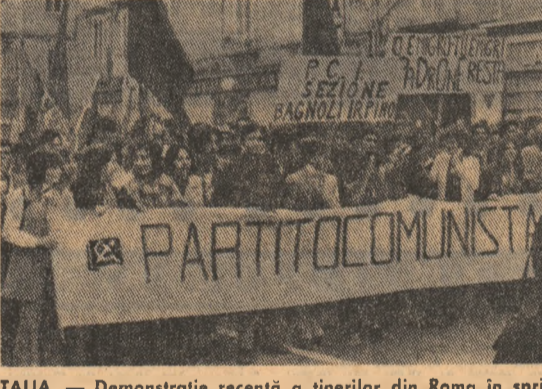
ITALIA. — Demonstrație recentă a tinerilor din Roma în sprijinul revendicărilor lor economice

● PREȘEDINTELE REPUBLICII LIBAN, Suleiman Frangieh, a prezidat o reuniune consacrată examinării evoluției situației interne și măsurilor recomandate a fi luate în domeniul informațiilor și securității, ca urmare a atacului de la aeroportul Lod”, informează agenția France Presse. La ședință au luat parte premierul Saeb Salam, ministrul afacerilor externe și apărării, fostul președinte al țării, Charles Helou, alte personalități politice. Premierul Saeb Salam a declarat: „La sfârșitul reuniunii, s-a convenit libanez înțelegând un contact permanent cu reprezentanții săi la Națiunile Unite”.