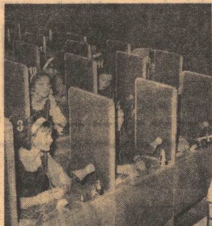
Cabinetul audio-vizual al liceului nr. 2 din Rădăuți