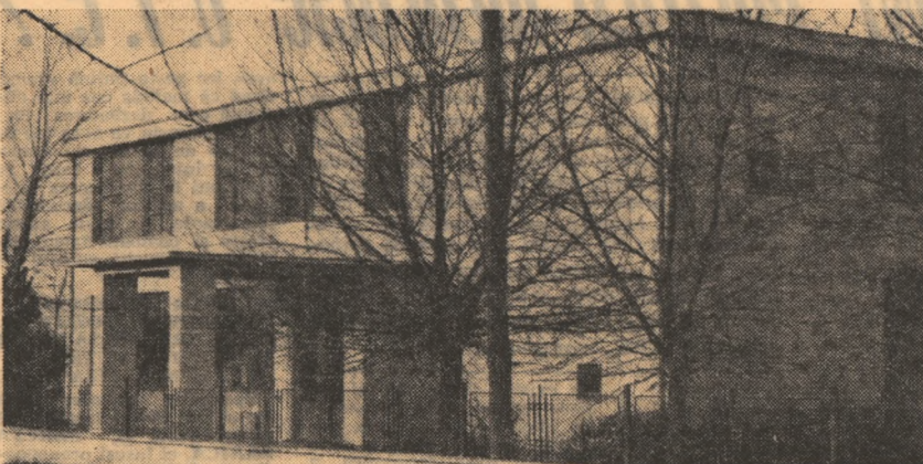
Clădirea liceului din Topraisar... Un edificiu obișnuit în multe din satele României socialiste.

care succes în opera de construcție a societății socialiste.