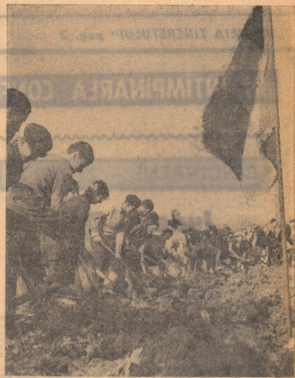
Munca se îmbină nemijlocit cu tineretea