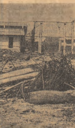
PE ȘANTIER: concretizare a lipsei de răspundere față de materiale.