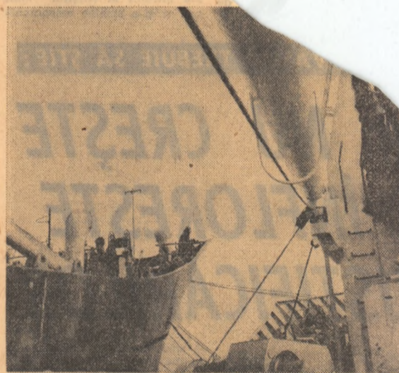
Imagine de pe șantierul naval Drobeta — Turnu Severin

Colectivele exploatarelor miniere „Dobrogea” — au hotărât să realizeze o producție suplimentară în valoare de 10 milioane lei — cu 3 milioane lei mai mare decât angajamentul inițial. Corelând graficul de execuție a celei de a doua linii tehnologice de la instalația de cretă măcinată din Murlatlar cu acțiunea de autototare, muncitorii de aici sînt hotărîți să folosească toate forțele pentru a pune în funcțiune această linie într-un timp mai scurt cu 6 luni față de cel prevăzut.