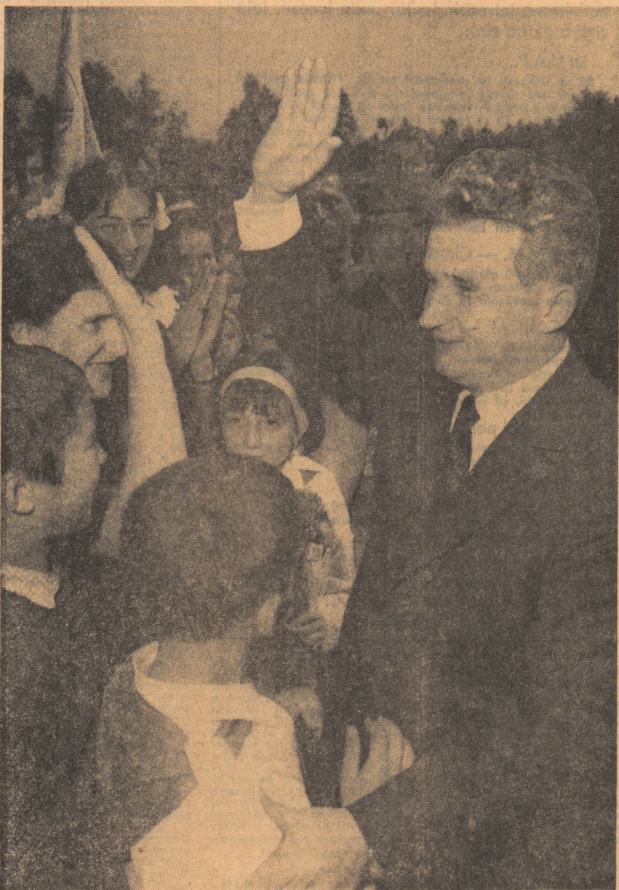
Întîlnire cu cei mai tineri cetățeni ai Argeșului. „Vă mulțumim din inimă, iubit conducător, pentru copilăria noastră fericită!”

La Vilcelele, 223 utești participă la o vibrantă întrecere socialistă sub deviza: