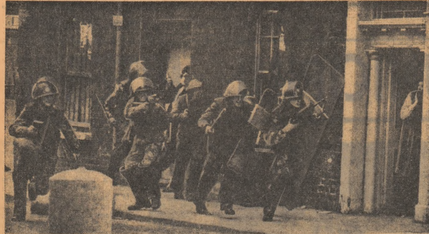
IRLANDA DE NORD. — Imagine din orașul Derry, unde au avut loc recent noi incidente