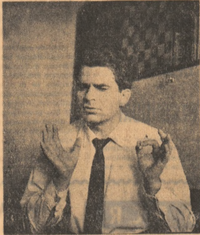
Șahul internațional de la Göteborg...