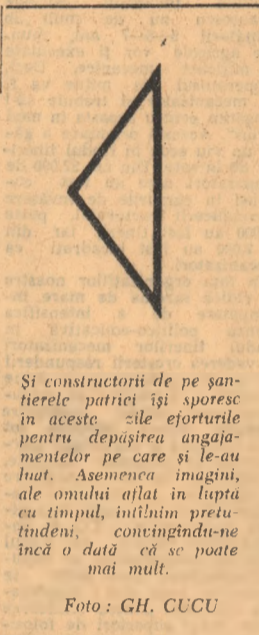
Și constructorii de pe șantierele patriei își sporesc în aceste zile eforturile pentru depășirea angajamentelor pe care și le-au luat. Asemenea imagini, ale omului aflat în luptă cu timpul, înfruntând pretutindeni, convingându-ne încă o dată că se poate mai mult.