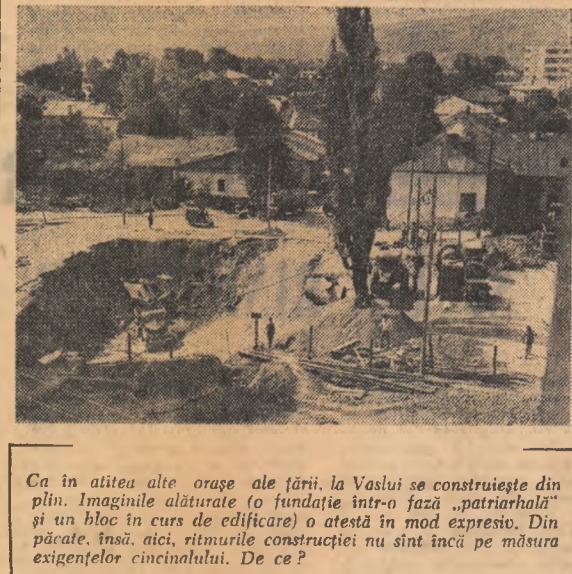
Ca în altele alte orașe ale țării, la Vaslui se construiește din plin. Imaginile alăturate (o fundație într-o fază „patriarhală” și un bloc în curs de edificare) o atestă în mod expresiv...

PETRE DRAGU GH. GHIDRIGAN