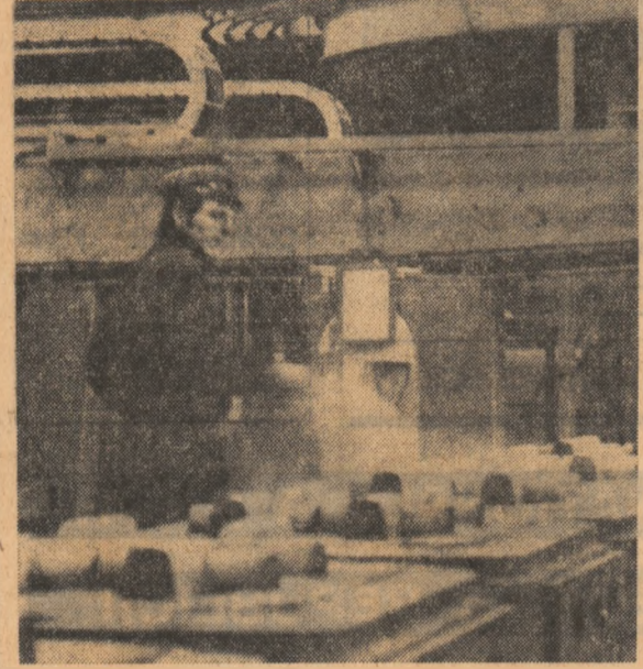
Noua și modernă turnătorie automată a Uzinei metalurgice Bacău