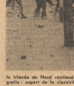
În Irlanda de Nord continuă incidentele sîngeroase. În fotografie: aspect de la ciocnirile de pe Hasting Street (Belfast)

În districtele Duy Tien și Binh Luc, aviația a făcut uz de bombe de mare calibrul, digurile fiind avariate pe o distanță de 300 m. În districtul Nai Hau, stațiunile de pompare au fost lovit de mii multe rînduri de către obuze de artilerie.