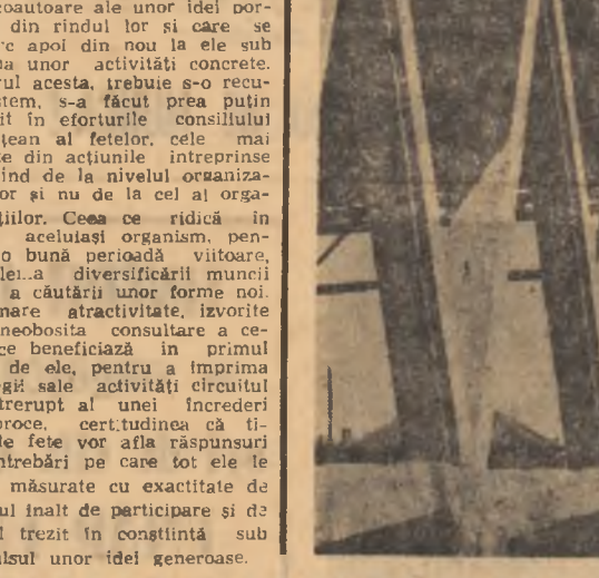
În vînt sub cupola vitroareii săli de sport din orașul Sîntu Gheorghe, cor răsuna primele urale entuziaste.