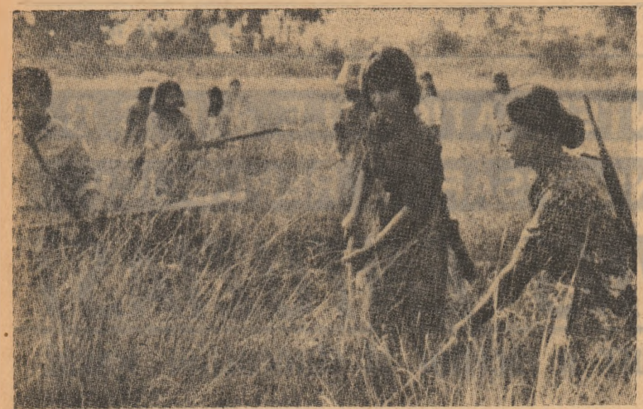
Într-una din regiunile eliberate ale Cambodgiei. Tineri muncesc pe cîmp, cu arma pe umăr, gata să-i înfrunte pe dușmani.

CONTINUINDU-ȘI VIZITA ÎN REPUBLICA DEMOCRATIA GERMANIA, Fidel Castro, primul secretar al C.C. al P.C. din Cuba, primul ministru al Guvernului Revoluționar, a fost, joi, oaspetele regiunii Halle — importantă centru al industriei chimice, aflată în apropierea orașului Magdeburg. El a fost însoțit de Werner Lamberz, membru al Biroului Politic, secretar al C.C. al P.S.U.G.