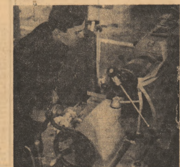
In fața strungului cu emblema calității, unul din tinerii muncitori ai Uzinei ardeleană.

memul construcțiilor de mașin-unelte, solicitate intens de fondurile economiei naționale, este vorba de strungurile revolver, de strungurile de repriză, strungurile automate multiax strungurile frontoane și strungurile paralele. — Natural, ne declară tovarășul inginer Ioan Demian, pe lângă planul prioritar, avem în obiectiv realizarea înalte de termen a indicatorilor ce ne revin în planul cincinal, mai precis, scoaterea unei mari serii de strunguri paralele care să satisfacă cererile crescânde la export, precum și ale beneficiarilor din țară. În vederea realizării acestor deziderate am început să ne preocupăm intens pentru crearea unor fluxuri tehnologice corespunzătoare prin mecanizarea și agregarea lor. Aici, are un cuvânt greu autoulterarea care în acest an va realiza 10 agregate importante. — Dar, totuși, unele strunguri românești sint mai grele decât altele de fabricație străină. Ce se preconizează pentru reducerea acestui decalaj? — La unele repere vom avea în curând o scădere a greutateii