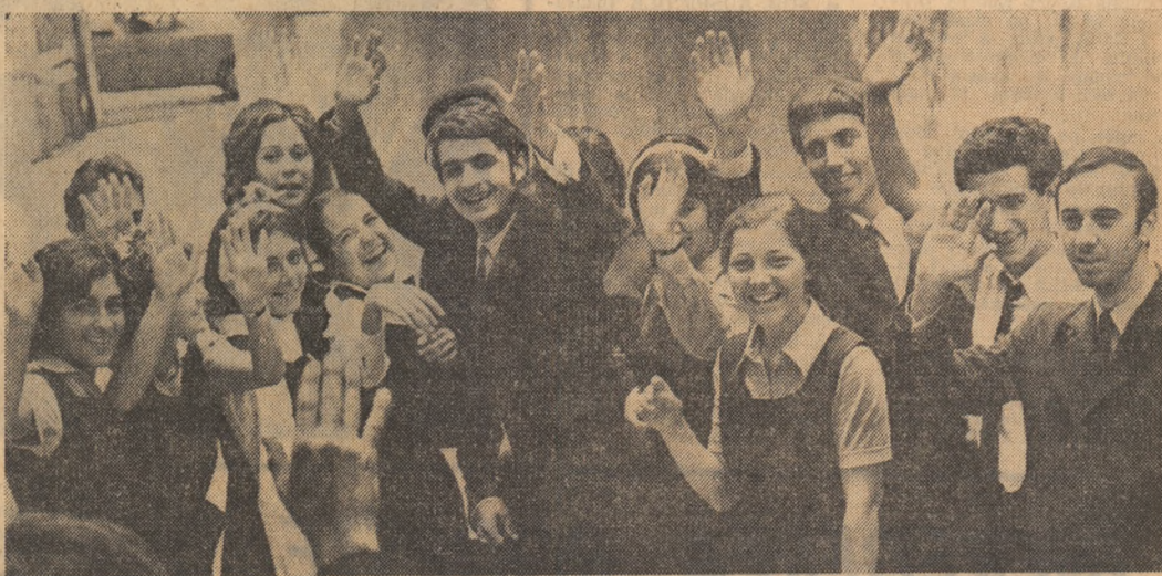
Vacanța 1972 și-a anunțat debutul. La orizont, se întrevide un program extrem de bogat, în cadrul căruia munca ocupă un loc central. Deocamdată, însă, fotoreporterul a surprins imaginea tradițională când elevii spun: „La revedere, școală!”

Din toată țara, UN RĂSPUNS ENTUZIAST la mobilizarea chemare a elevilor și studenților ieșeni