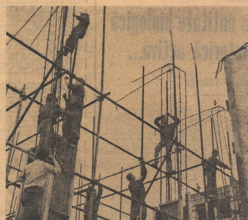
Astăzi constructori, mine beneficiari

Analizînd rezultatele obținute pînă acum ne exprimăm hotărîrea de a ridica activitatea noastră la un nivel superior, urmînd ca, pe baze științifice, să elaborăm lucrări care să contribuie în măsura din ce în ce mai mare la folosirea rațională a teritoriului țării, la eficacitatea economică a investițiilor, la satisfacerea într-un grad sporit a exigențelor în continuă creștere ale cetățenilor patriei noastre.