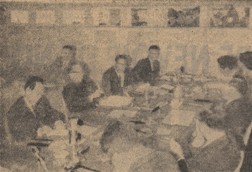
Aspect din timpul unei întâlniri din cadrul convorbirilor preliminare dintre reprezentanții organizațiilor de Cruce Roșie din R.P.D. Coreeană și Coreea de sud.