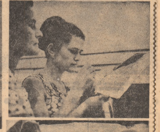
Consulind harta, cercetind repartizarea...

În zilele de 1-2 Iulie s-a desfășurat în întreaga țară repartizarea absolvenților acestui an din institutele tehnice, universitățile (seria de 5 ani), institutele de arte plastice, teatru și conservatoare, precum și din institutele pedagogice de trei ani.