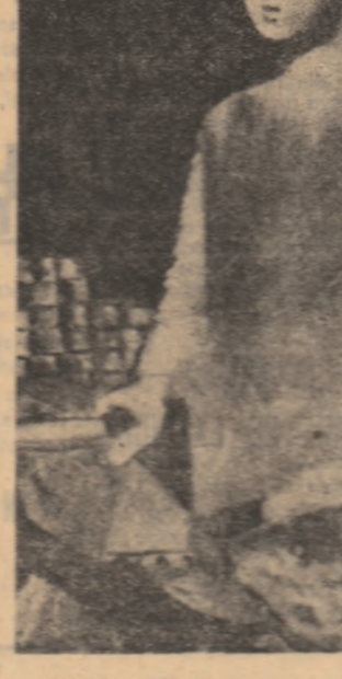
COSTIN NEAMTU — „La cheana”