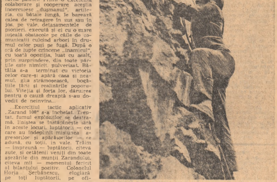
Acțiunea „Zarand 100” se încheie în programul de pregătire a pionierilor și tineretului pentru apărarea patriei și are, în acest context, o dublă semnificație, urmărind, în primul rând, traducerea în viață a sarcinilor stabilite de partid, de secretarul

Exercițiul tactic aplicativ „Zarand 100” s-a încheiat. Treptat, fumul exploziilor se destramă, liniștea se înalțea iară în acest loc, luptătorii — cei care au înălțea misiunea agresorilor și apărătorilor — se adună, cu toții, în vale. Trăim — împreună — luptătorii, citiva sute și cetățenii veniți din toate așezările din munții Zarandului, citiva mii — momentul fericit al bilanțului pozitiv. Colonelul Horia Serbănescu, elogiază pe toți luptătorii, pe ofi-