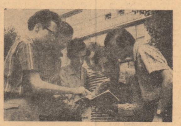
Lotul nostru pentru apropiata întrecere a elevilor fizicienilor.

Preambul la o nouă ediție a olimpiadei internaționale a elevilor