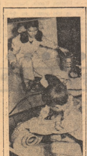
Sîmbătă, s-a deschis, la Muzeul de istorie a partidului comunist, a mișcării revoluționare și democratice din România, expoziția „MINI-TEHNICUS — 1972” aflată la a 5-a ediție. Cîții reportajul nostru în pag. a III-a.

Tineretea satului se anunță ca o sîrbătoare a vieții însăși, dornică să arate lumii puterea fără sfîrșit a creației permanente.