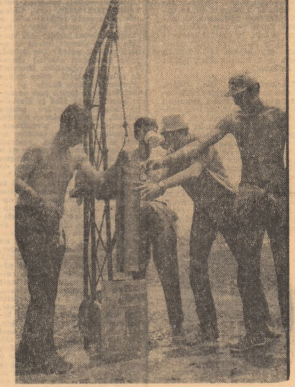
După o activitate meritorie, băieții fac coadă la... fîntină