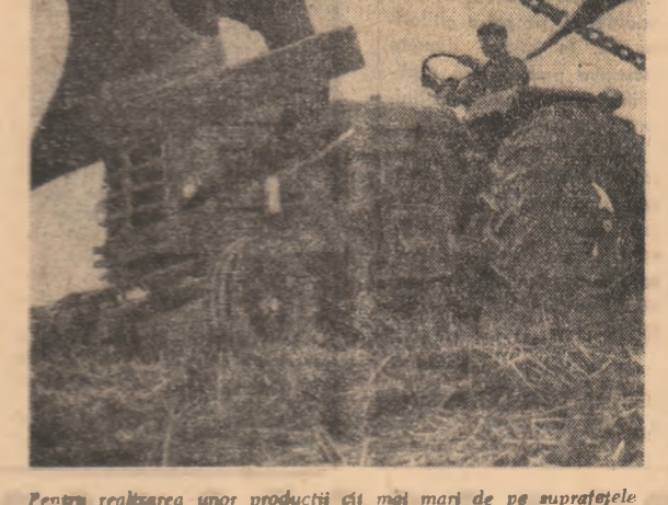
Pentru realizarea unor producții cît mai mari de pe suprafețele destinate însămînțării culturilor duble, mîștrea arde trebuie transformată în cel mai scurt timp în ogor proaspăt. Ceea ce și fac în aceste zile mecanizatorii din județul Olț.

cazarea este asigurată în lîrta și pe pontoanele-jocuri. Vizitatorii au la dispoziție un club în aer liber, terenuri sportive voley, handbal, fotbal, pistă de popice, șalupă și un bac pentru plimbări pe Dunăre, stație de radioamplificare. Pescarii amatori își pot organiza aici partide de pescuit în toată regula. — Din păcate, la această întrebare nu vă putem da un răspuns favorabil. Pînă acum, prea puțini au fost tinerii din țară care au vizitat bazele noastre turistice. Și aceasta mai ales fiindcă sînt mai puțin cunoscute. Noi avem posibilitatea să asigurăm în cele mai bune condiții petrecerea vacanței de vară pe serii, pentru tinerii din toate județele țării care doresc acest lucru încredinșându-l că se vor bucura din plin de servicii impecabile și un cadru natural optim pentru petrecerea vacanței de vară într-un mod cît mai plăcut, cît mai reconfortant.