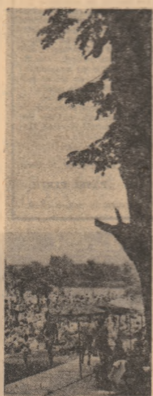
Pe plajă, la Snagov.

La sfîrșitul săptămîinii, de obicei, bucureștenii aștează zonele de agrement din imediata apropiere a orașului — Băneasa, Floreasca, Tei, Cernica. Posesorii de autoturisme se înscrub în coloana nesfîrșită ce se îndreaptă spre Snagov sau străbate Valea Prahocet. Excursiile în aceste locuri, devin deja clasice, datorită aglomerării, ajung să obosească vizitatorii. Dar omul s-a obișnuit și îi vine greu să schimbe obișnuința cu exploatarea, și costă altă zonă de agrement, și atunci, în duminică următoare, revine, face plajă, inghite praf, este călcat și deranjat, se ingherule și așteaptă la un chioșc, pînă la exasperare, să cumpere un suc sau ceva de mâncare. Dar în împrejurimile Capitalei sînt încă multe locuri care prin condițiile naturale și materiale pe care le oferă îmbină în mod fericit odihna fizică și reconfortarea intelectuală. Distanța respectabilă pînă la aceste locuri, mijloacele de transport în comun, sau cele puse la dispoziție, la cererea, de Agenția B.T.T. din București, în număr suficient, pentru autoturismul nu se ridică la probleme, le fac foarte accesibile tuturor celor care vor să petreacă cîteva ore din timpul liber cît mai plăcut, să se odihnească în mijlocul naturii și să-și îmbogățesc universul cultural.