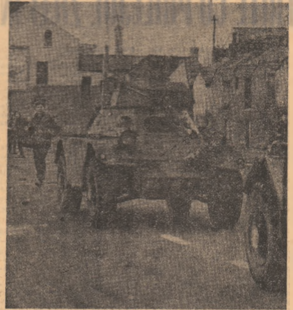
Fotografia noastră prezintă o imagine caracteristică actualității de mare tensiune din Ulster: un car de luptă britanic patrulând pe străzile Belfastului.