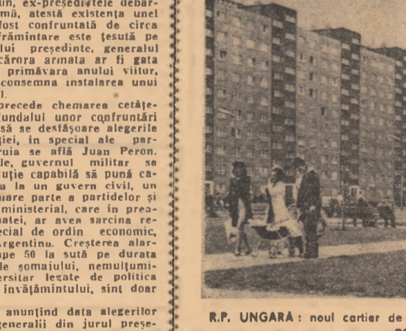
R.P. UNGARĂ: noul cartier de locuințe Kelenföld din Budapesta.

În afară de aceasta, în ultimul timp au apărut noi perspective favorabile pentru dezvoltarea colaborării economice, a spus Roger Seydoux. Începând din luna Ianuarie a acestui an, industria franceză a livrat Uniunii Sovietice utilități industriale în valoare totală de 1.700.000.000 franci. Se află în studiu de studiere în comun proiecte de mare însemnătate. Este vorba, de exemplu de participarea industrială franceză, în speta a firmei „Renault”, la construirea uzinei de automobile de pe riuul Kama. În anul 1971, livrările de mărfuri sovietice în Franța au sporit cu peste 25 la sută. Anul acesta, ele continuă să crească într-un ritm asemănător. Se extind livrările de utilități sovietice în Franța. După cum se știe, U.R.S.S. urmează să furnizeze o parte a utilitatilor pentru complexul metalurgic din orașul Fos-sur-Mer. În afară de aceasta, se discută tratative cu privire la livrarea de utilități sovietice pentru construirea unei rafinerii în Franța intenționează, de asemenea, să achiziționeze gaze naturale din Uniunea Sovietică.