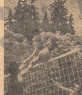
Cite ambiții nu s-au consumat pe terenurile de sport.