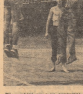
Instanțanșe de la VASILE BANGA