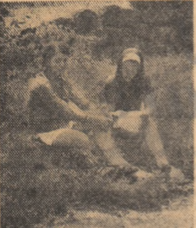
Să nu fim induse în eroare și să citim o scrisoare abia primită.