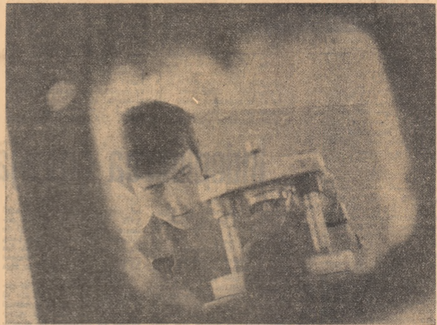
A face din meserie o adevărată artă, iată obiectivul perfecționării profesionale a fiecărui tînd muncitor