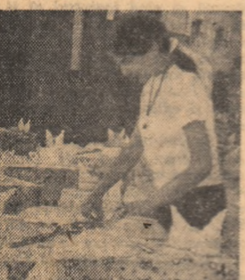
Tabără se află în plin program. Dar echipa de serviciu îi pregătește surpriza de la orele mesei.