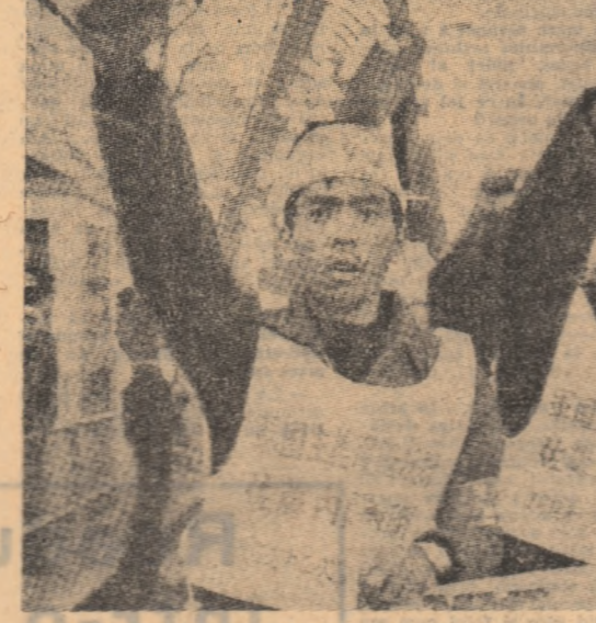
Aspect de la o demonstrație a locuitorilor Okinawai pentru lichidarea tuturor bazelor militare americane de pe insulă.

Noul guvern libian, condus de Abdel Salam Jalloud, a depus jurământul duminică seara în fața președintelui Consiliului Comandamentului Revoluției din Libia, Moamer El Gaddafi — anunță agenția France Presse și United Press International. După depunerea jurământului, prezidează agenția L.P.P., a avut loc o sesiune comună a Consiliului Comandamentului Revoluției și a noului cabinet libian.