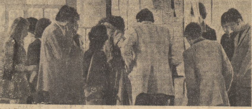
Tineri licențiați francezi în fața unui birou de plasare: „Peste tot ni se răspunde: complet!”.