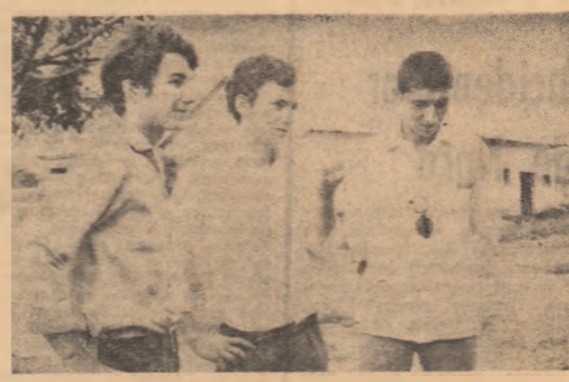
Noi nu știm nimic despre o asemenea inițiativă, dar la materializarea ei am putea participa și noi, elevii aflați în vacanță.