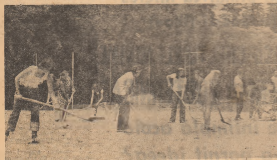
La Caracal, în tabăra uniformelor albastre