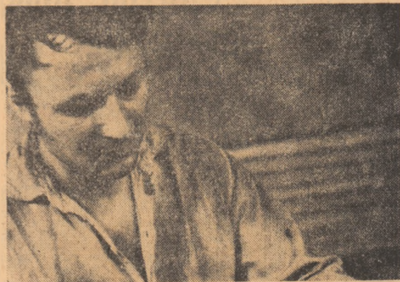
La Uzina „Semănătoarea“: cei care și-au propus să sprijine pe cooperativă din Ștefănești, nu-și preocupă timpul și efortul

DOUĂ SECVENTE DIN FOTO-ANCHETA PE CARE O PUBLICĂM ÎN PAGINA A III-A.