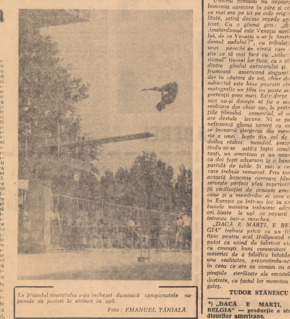
La Ștrandul tineretului s-au încheiat duminică campionatele naționale de juniori la sărituri în apă.