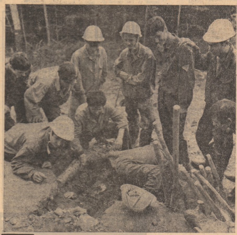
Izvorul cumințit de miinile noastre ne îmbră cu apă ca gheața.