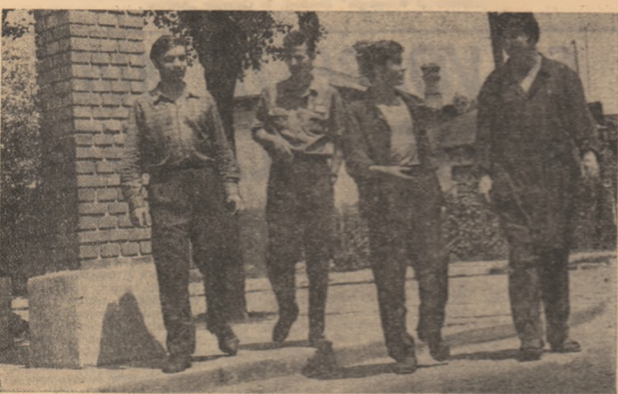
Patru băieți observă din „Cetatea muncii”.