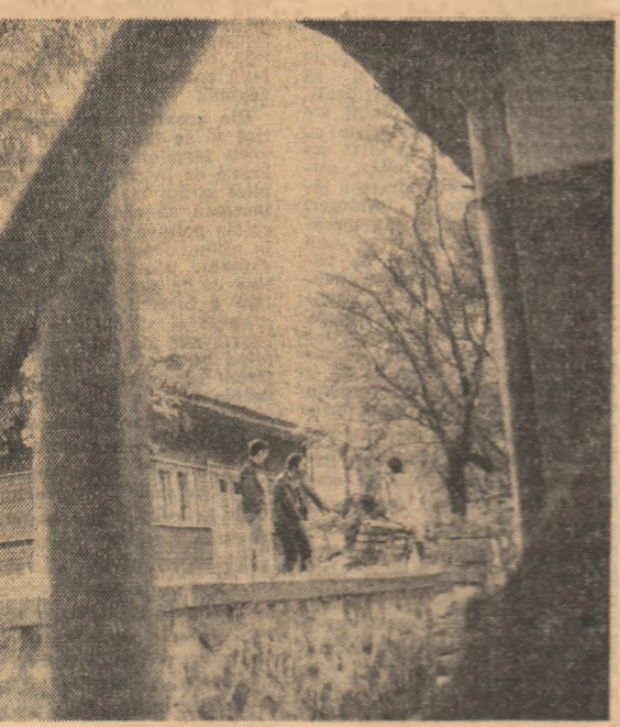
În tabăra studențescă de la Izvorul Mureșului.

liberă. O să mi-o taie din salariu. Ei și? Este mai mult decât insolent, căzînd o concepție de totuși despre muncă, despre obligațiile salariaților.