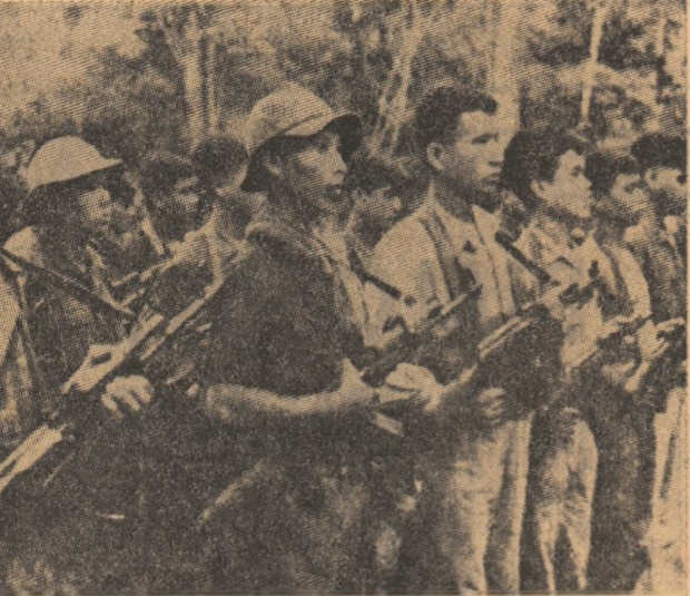
Un detașament al forțelor de rezistență populară din Cambodgia, înainte de a porni într-o misiune de luptă