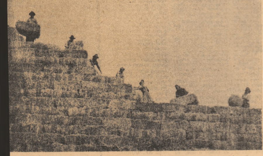
Turia, fiecare gram de furaj este depozitat cu grijă maximă. Ceea ce acum se așează în „cămară“ va însemna producție de lapte în anotimpul rece