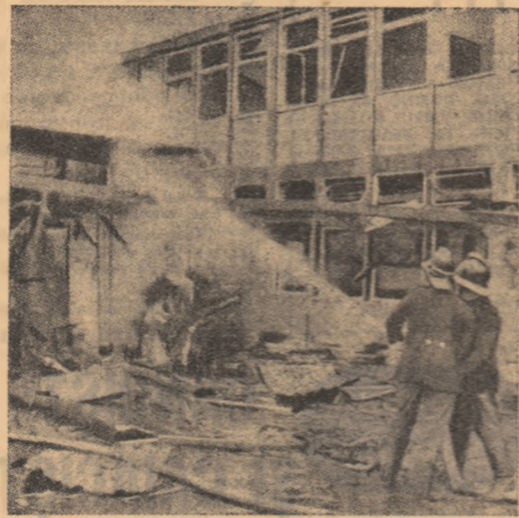
IRLANDA DE NORD. — O scenă aproape cotidiană la Belfast: stingerea incendiilor provocate de explozii.

După cum menționează agenția Reuter, Gunnar Jarring a exprimat, în cadrul întrevederii, hotărârea sa de a continua eforturile pentru a găsi o bază de soluționare a conflictului potrivit prevederilor rezoluției Consiliului de Securitate din noiembrie 1957.