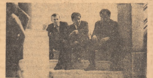
În gară la... minister!

FOTO-ANCHETA NOASTRĂ Leit-motiv la re-repartizare: DE-AR FI TOATE COMUNELE COLEA, LA MUZEUL SATULUI!