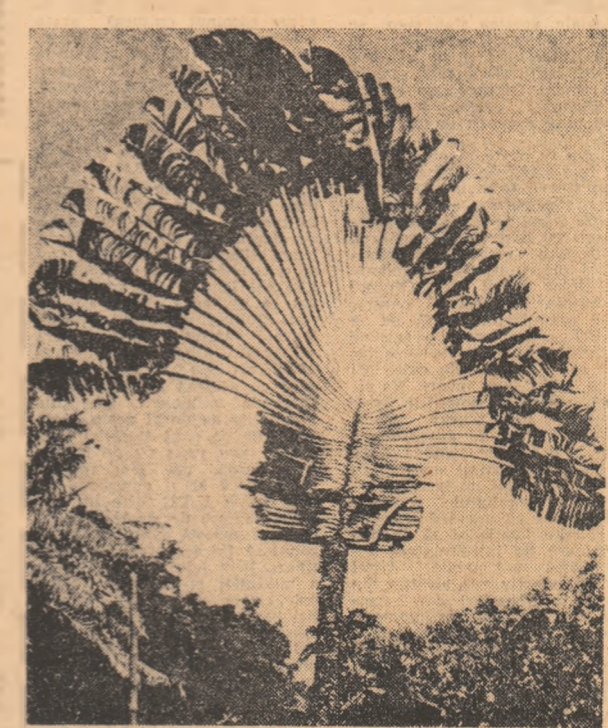
Una din capodoperele florei tropicale: „arboarele vieții”.

Primul ministru al Japoniei, Kakuei Tanaka, a anunțat că va face în curînd o vizită în R. P. Chineze, în vederea normalizării relațiilor dintre cele două țări.