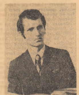
Să nu cunoască juristul Gh. Popescu legile țării?