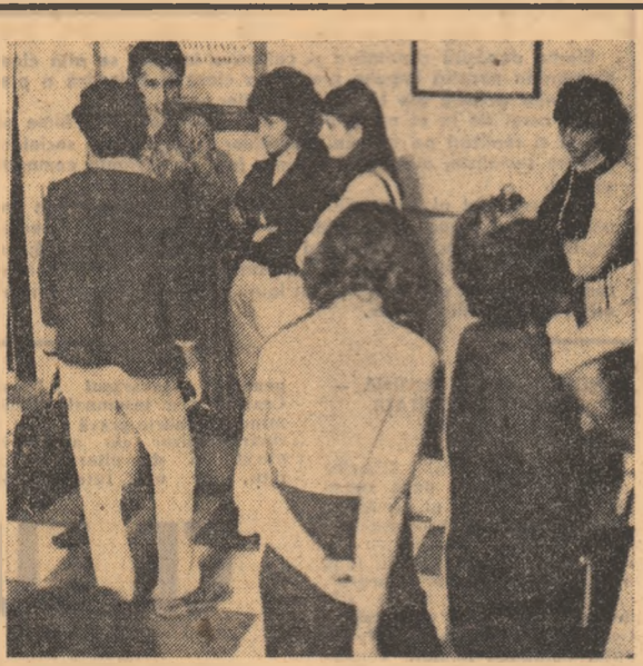
Tinerii din imagine, ingineri, profesori, specialiști din promoția 1972, nu sînt la locurile de muncă și în audiență pentru schimbarea repartizării.

Ce va face mai departe? Va deveni una dintre persoanele figurînd curent pe lista de audiență la serviciul care se ocupă de rezolvarea cererilor privind schimbarea repartizării, din Ministerul Educației și Învățămîntului.