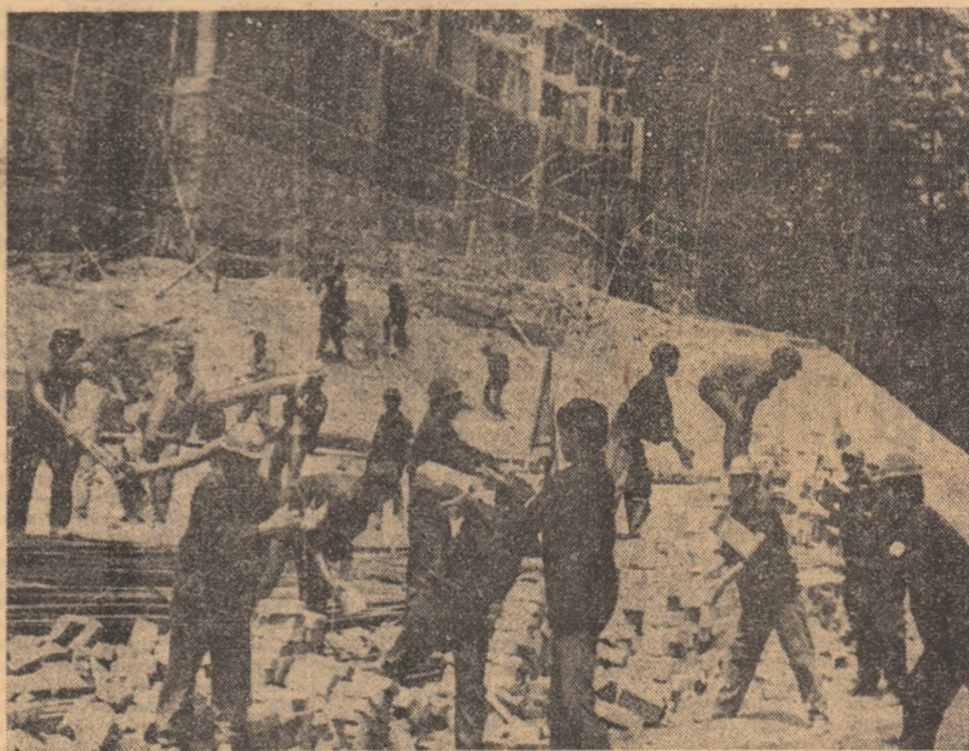
Elevii ai școlilor profesionale din județul Prahova la muncă voluntar-patriotică pentru construirea Complexului turistic al tineretului din Bușteni.