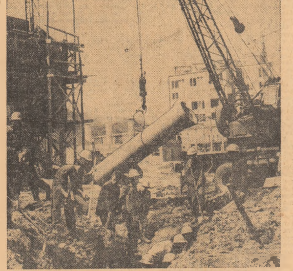
Mindria de a fi părtași la ridicarea unor obiective importante pentru economia națională.

IN PAG. III — IV — V CENTRELE ȘI PREȘEDINȚII COMISIILOR EXAMENULUI DE BACALAUREAT LA LICEELE DE CULTURĂ GENERALĂ, LA LICEELE DE SPECIALITATE, ȘI CENTRELE ȘI PREȘEDINȚII COMISIILOR EXAMENULUI DE DIPLOMĂ LA LICEELE ȘI INSTITUTELE PEDAGOGICE DE ÎNVĂȚĂTORI ȘI EDUCATOARE