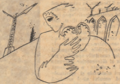
Desene de MIHAI SINZIANU

în această vară luminată de chipuri oamenii mei, aur văzută de păsări, aur în adierea lumii!