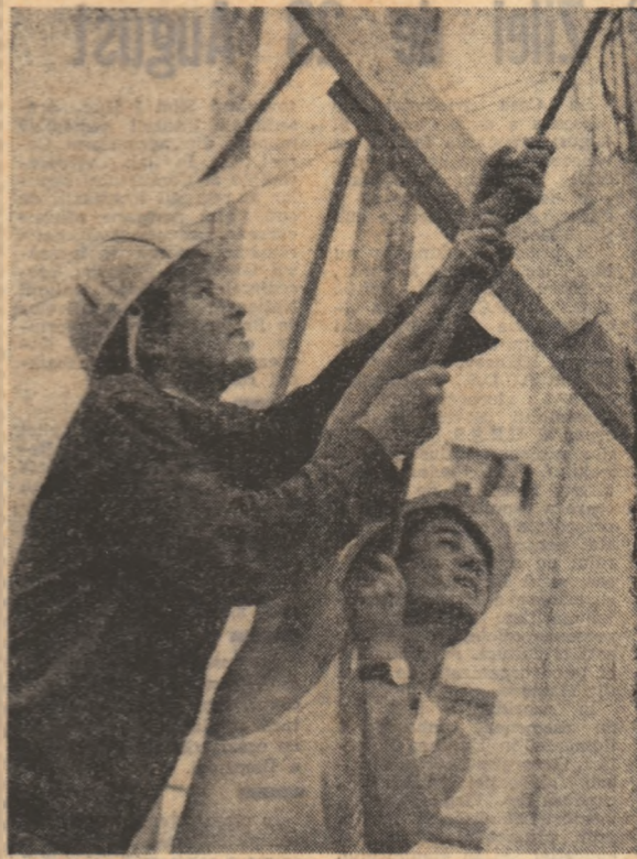
„Vacanța în salopetă de brigadier.”

lută. Au intrat în funcțiune noi capacități industriale, unități comerciale, un spital și alte obiective social-culturale, au fost date în folosință înainte de termen 1.500 de apartamente. Sintem conștienți că toate aceste succese raportându-le doar un început de drum realizării angajamentului de a da în acest cincinal o producție de 52 miliarde lei peste plan, că ele trebuie dezvoltate printr-o atenție și judicioasă folosire a tuturor resurselor de care dispune Capitala, potrivit programului însușițorilor adoptat de Conferința Națională a Partidului Comunist Român. În această zi de sărbătoare, vă încredințăm, stimate tovarășe secretar general, că organizația de partid a Capitalei, toți locuitorii Bucureștiului, vor acționa neabătut, cu abnegație și deosebită răspundere patriotică, pentru înfăptuirea hotărârilor Conferinței Naționale a partidului, contribuind prin fapte durabile la înălțarea edificiiului luminos al socialismului, la înălțarea României în rîndul statelor avansate ale lumii contemporane. Ne angajăm și cu acest prilej să transpusem în practică prețioasele dumneavoastră indicații privind dezvoltarea economică și săditărilor socialiste în municipiul București, pentru a face din Capitală țărî un oraș tot mai înfloritor. Înzăduiți-ne, iubite tovarășe Nicolae Ceaușescu, să vă transmitem urări de sănătate și putere de muncă, spre binele poporului român, al cauzei socialismului și comunismului!