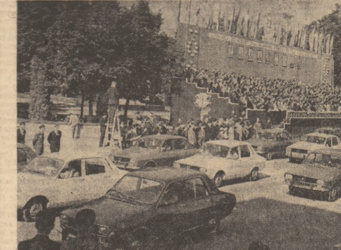
PITEȘTI. — O prestigioasă carte de vizită a muncitorilor piteșteni: automobilul românesc.

defilat prin fața tribunalelor nu puteau lipsi minunații brigadieri ai Lotului.