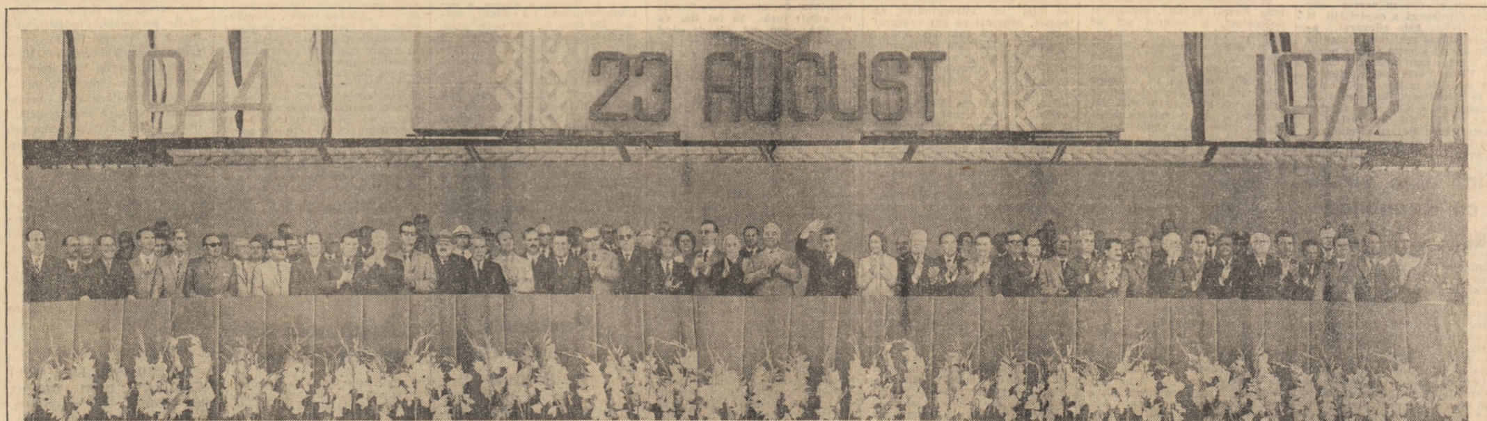
Tribuna oficială într-unul din momentele desfășurării demonstrației oamenilor muncii din Capitală.