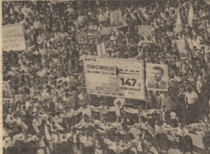
Un angajament al întregului nostru popor — cincinul înainte de termen!