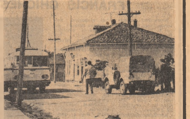
Elementele civilizației urbane schimbă înfățișarea tradițională a satului.

decît decît să acționăm conform schițelor. Am vizitat Lehlui-gară și Dragalina, primele două comune care vor deveni localități urbane. Dragalina, sat relativ nou (anul atestării documentare fiind 1924), împreună cu satele învecinate are 11.000 de locuitori. Situată la intrătoria a două căi feroviare importante (București-Constanța și Călărași-Slobozia), cit și la intrătoria unor drumuri naționale și județene, Dragalina are largi perspective de dezvoltare economică-socială. Viitorul centru civic va fi amplasat la nord-vest de stația de cale ferată.