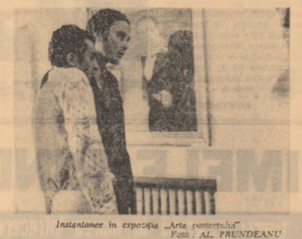
Instantanee în expoziția „Arta postmodernă”