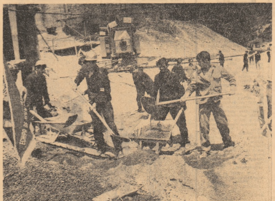
La munca cimpului tinereii brigadieri și-au adus o contribuție însemnată