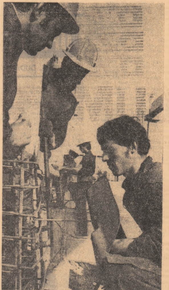
Instalatorii — pe paralelele rîmului înalt și a calității ireproșabile Fotografii de O. PLECAN