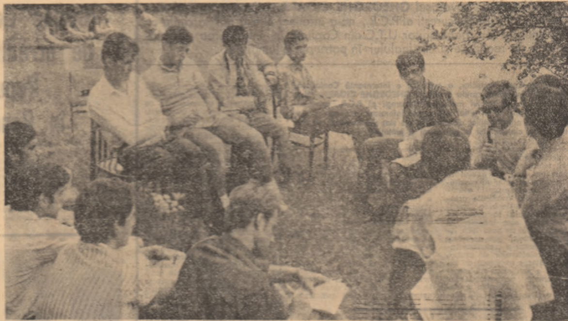
In tot mai multe școli cabinetele de științe sociale se integrează deplin în activitatea politico-ideologică.