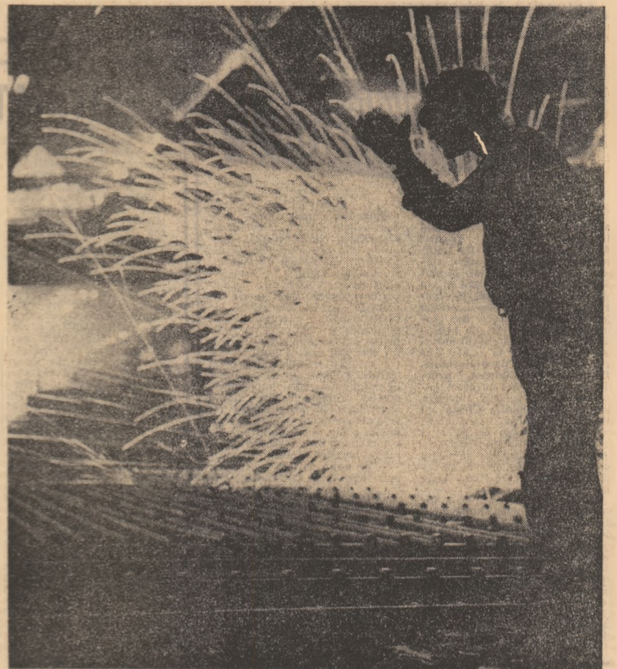
Dialogul focului (secția de laminare a Uzinei metalurgice Iași).