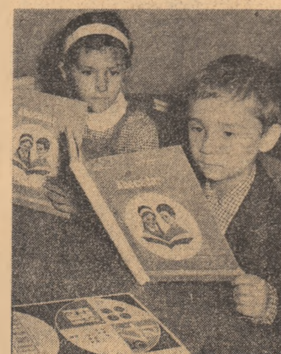
Primele ore de contact cu școala au însemnat și dezlegarea primelor taine ale abecedarului

BINE TE-AM GĂSIT ȘCOALA, AU ROSTIT IERI 4 500 000 DE ELEVII Ieri au pășit pragul școlilor patru milioane și jumătate de elevi. Reîntîlnirea emoționantă cu dascălii și localurile de învățămînt parcă mai frumoase, nu neapărat datorită atmosferei festive, ci prin schimbările structurale luate în concepția procesului instructiv, a fost marcată de angajarea solemnă a perfecționării continue a complexei vieți școlare. Am fost prezente la Liceul „Ion Neculce” din Capitală, unde prima oră de clasă a fost transformată în prima oră de laborator, de atelier, de cabinet școlar sau de producție. Aici, de la 15 septembrie, zestre școlii a sporit cu un nou atelier de prelucrări mecanice dotat cu strunguri, freze și raboteze, trei noi ateliere de lăcătușerie și ajustaj, un atelier de bobinaj, adăugîndu-se, astfel, la vechile meserii pregătite în școală — programatori, depanatori aparate electronice, conducători auto, alte profesii noi: ajutor, bobinator, frezor, strungar. Subliniind importanța acestui (Continuare în pag. a V-a)