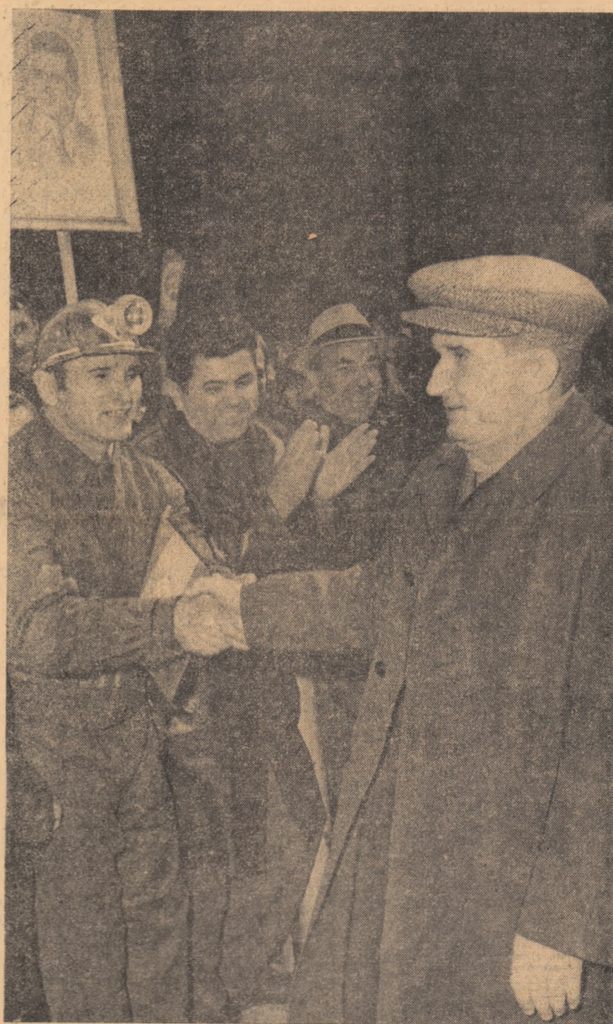
„ȘTIU CĂ MINERII SÎNT OAMENI DE CUVÎNT; ÎNTODEA UNA EI AU CONSTITUIT UN DETAȘAMENT PUTERNIC AL CLASEI NOASTRE MUNCITOARE, UN DETAȘAMENT DE ÎNCREDERE AL PARTIDULUI. PARTIDUL S-A PUTUT BIZUI ÎN TRECUT ȘI SE BIZUIE ȘI ASTĂZI CU ÎNCREDERE PE MINERII DIN VALEA JIULUI!”

Pretutindeni, pe baza unei largi consultări cu oamenii muncii, cu specialiștii, conducătorul partidului a dat indicații prețioase privind organizarea activității economice și sociale. Indemnurile, indicațiile sale au fost primite cu multă satisfacție, cu înaltă încredere de oamenii muncii, care s-au angajat să facă totul pentru ca obiectivele destinate înfloririi patriei, prosperității generale să fie îndeplinite cu succes, pentru ca hotărârile Congresului al X-lea al partidului — cauză a întregului popor — să fie traduse exemplar în viață.