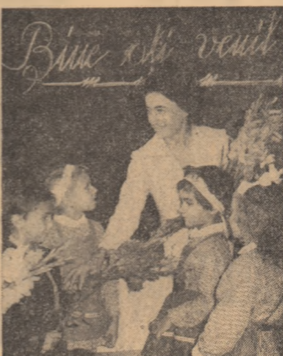
„Bine ați venit”, este urarea pe care au adresat-o profesorii elevilor. Iar școala le-a adresat-o și unora, și altora

BINE TE-AM GĂSIT ȘCOALA, AU ROSTIT IERI 4 500 000 DE ELEVII Ieri au pășit pragul școlilor patru milioane și jumătate de elevi. Reîntîlnirea emoționantă cu dascălii și localurile de învățămînt parcă mai frumoase, nu neapărat datorită atmosferei festive, ci prin schimbările structurale luate în concepția procesului instructiv, a fost marcată de angajarea solemnă a perfecționării continue a complexei vieți școlare. Am fost prezente la Liceul „Ion Neculce” din Capitală, unde prima oră de clasă a fost transformată în prima oră de laborator, de atelier, de cabinet școlar sau de producție. Aici, de la 15 septembrie, zestre școlii a sporit cu un nou atelier de prelucrări mecanice dotat cu strunguri, freze și raboteze, trei noi ateliere de lăcătușerie și ajustaj, un atelier de bobinaj, adăugîndu-se, astfel, la vechile meserii pregătite în școală — programatori, depanatori aparate electronice, conducători auto, alte profesii noi: ajutor, bobinator, frezor, strungar. Subliniind importanța acestui (Continuare în pag. a V-a)