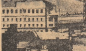
U.R.S.S. — Imagine din Moscova.

Agencia France Presse anunță, citind un purtător de cuvînt al trupelor regiunii de la Pnom Penh, că în regiunea Neak Luong, situată la 64 km sud-est de capitală, situația trupelor laonlezi s-a agravat brusc. Ele au fost obligate să evacueze — pentru a doua oară în decurs de 7 zile — colina Choeu Kach, considerată ca avînd o mare importanță strategică. Zona respectivă, situată în Delta Mekong, are o importanță deosebită pentru baza fluvială de la Neak Luong, controlul asupra acesteia reprezentînd o problemă vitală în ce privește accesul în Delta Mekongului, afiliată în cea mai mare parte în minimele forțelor patriotice khmer de rezistență. De asemenea, continuă săptele pe frontul de pe soseaua nr. 5 și în zona localității Ponei, situată la 100 km nord-est de Pnom Penh, unde patrioții dețin poziții foarte puternice.