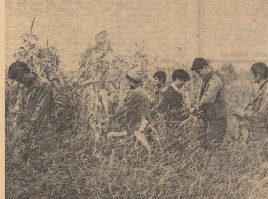
Recoltatul porumbului este lucrarea ce concentrează cea mai mare parte din forța de muncă a satului. Explicabil! Porumbul ocupă peste trei milioane și jumătate de hectare. Iar în sprijinul cooperativelor și mecatizatorilor au centi aproape o jumătate de milion de elevi și studenți, alte câteva zeci de mii de tineri muncitori, tehnicieni, ingineri și funcțio- nari. În orele de practică ei lucrează cot la cot cu părinții lor, cu frații și căminii. Pentru că mulți dintre ei sînt fii ai satului. Și, în plus, imaginarea fără pierdere a noii recolte este o chestiune de înalt patriotism, o datorie a fiecărui membru al societății.

● ZILE HOTĂRITOARE ÎN BĂTĂLIA RECOLTEI ● INIȚIATIVE UTE- CISTE ÎN SPRIJINUL CAMPAZIEI ● MIJLOACE DE TRANSPORT DE- SERVITE DE TINERI ● „SĂ DEPĂȘIM VITEZA ZILNICĂ PLANIFICA- TĂ” — O CHEMARE CU PUTERNIC ECOU ÎN COOPERATIVELE AGRI- COLE DIN TELEORMAN ● ÎN DOLJ, UN ANGAJAMENT CARE SE ÎNDEPLINEȘTE: „FIECARE TINĂR SĂ RECOLTEZE CEL PUȚIN UN HECTAR DE PORUMB”