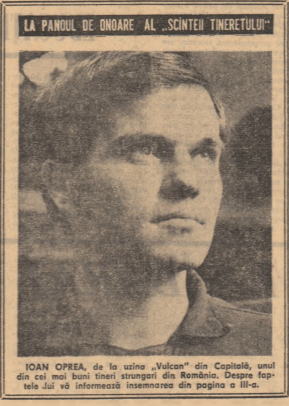
LA PANOUL DE ONOARE AL „SCINTEII TINERETULUI”