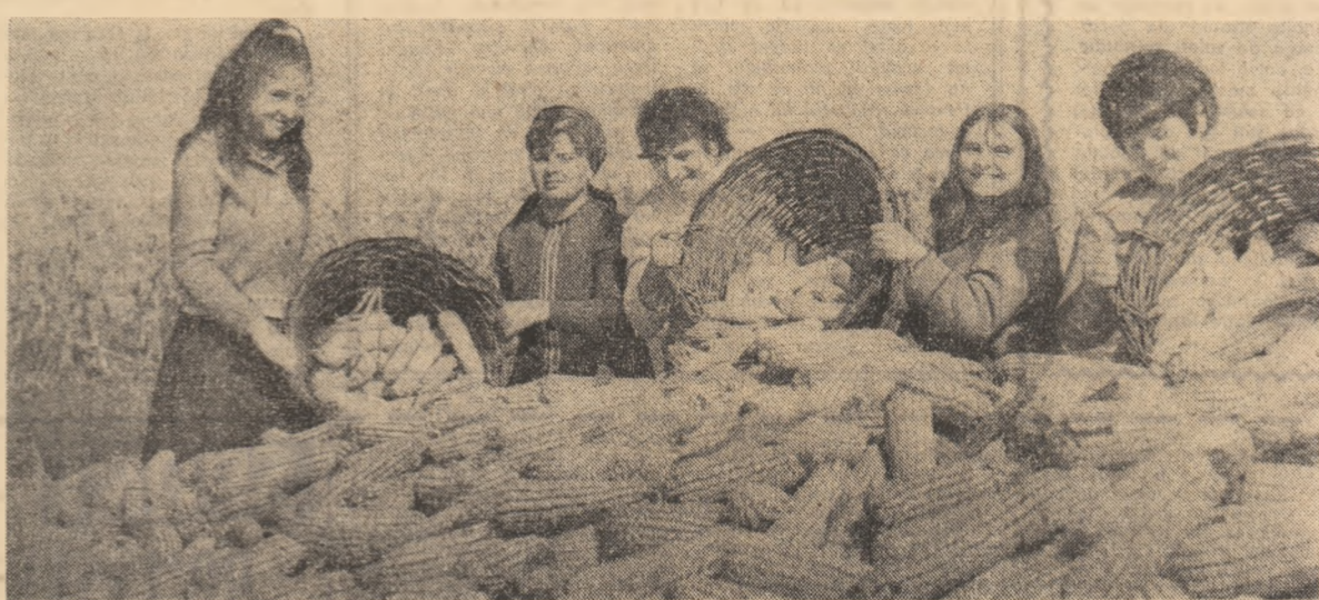
La C.A.P. Făcăieni, județul Ialomița, recoltatul porumbului e în toi

Din Insula Mare a Brăilei, reporterul nostru comunică: La toate fermele bătălia culesului a intrat în plin