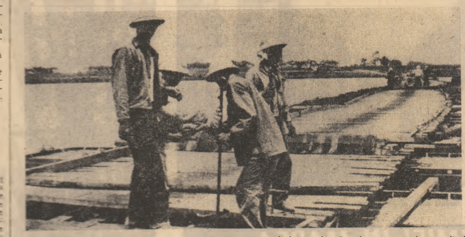
R.D. VIETNAM : Cu mare rapiditate, un pod bombardat de aviația americană a fost reparat de muncitorii