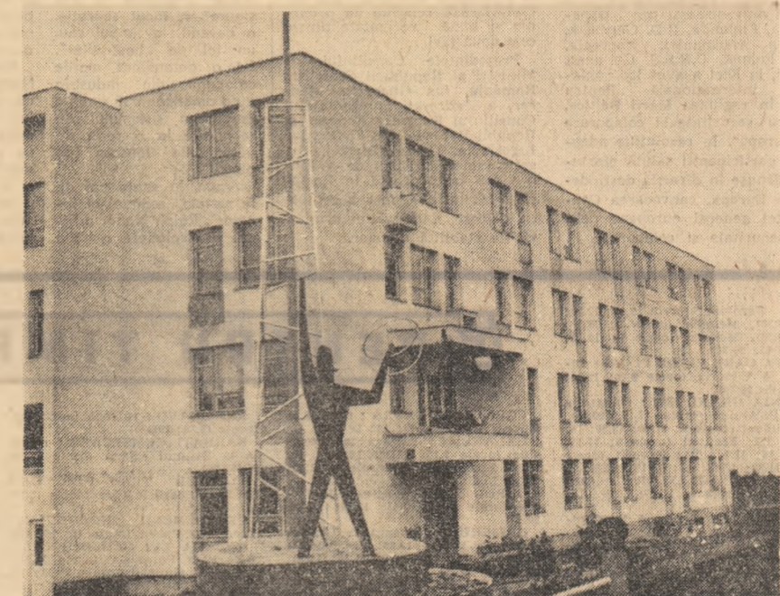
La dispoziția viitoarelor cadre — elevii Școlii profesionale și ai Liceului industrial — se află modernul cămin din imagine

Pagină realizată de ADINA VELEA