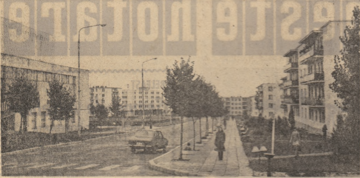
Orșadul Victoria — un oraș cu noul mod de viață modern