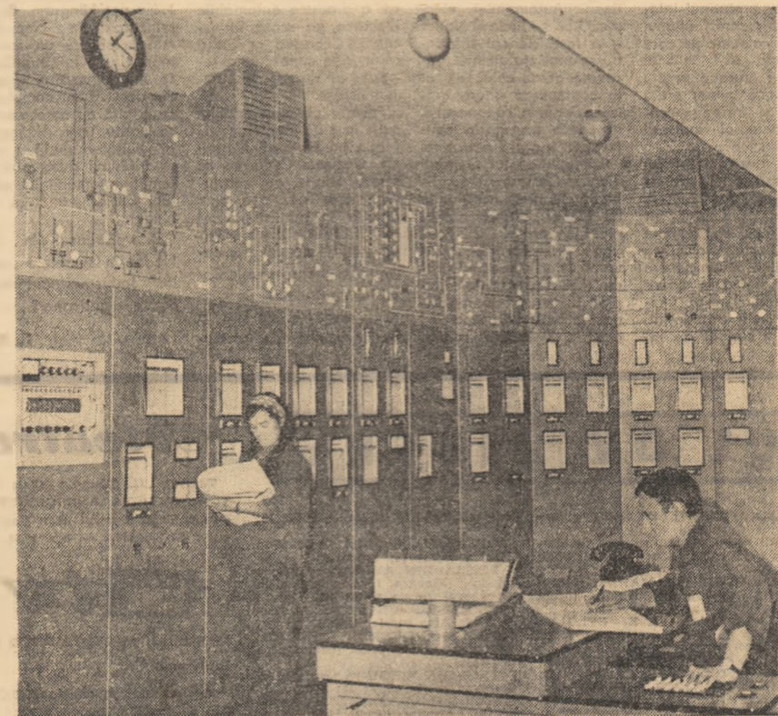
Operatorii Combinatului deservesc o aparatură de înalt nivel tehnic

Răsfoind cartea de onoare a așezării, întîlnim înscrise fapte demne de menționare iar cei care le-au dat viață sînt tinerii fiindcă la Victoria tinerețea e pretutindeni... Generația care a primit actul de naștere o dată cu orașul în care s-a născut n-are decît 17 ani! Părinților lor li se datorează înflorirea acestor plaiuri. De la mic la mare au venit să defrîșeze pădurea pentru a putea să se înalte noi clădiri de fabricație. Ei au plantat pomi ornamentali și multe flori. Au muncit în timpul liber la construcția clubului muncitoresc, a magazinului universal, a cantinei, la înălțarea Grupului școlar de chimie. Au fost ridicate blocuri moderne, spațioase. Acum orașul arată ca o cochetă stațiune turistică. Il străjuesc creștele Negoiului și Moldovanului cu culmile împădurite iar vegetația ce îl înundă pare a fi adusă din lumea Oltului. Fiecărui locuitor al tînarului oraș îi revine o suprafață de 90 m.p. de zonă verde! Ei își iubesc orașul, meseriile dobîndite, combinatul — cetatea chimiei de care s-au legat pe viață — admiră dantelăria imenselor fabrici de acasă, cu emoție — acesta este locul unde ei s-au format și au devenit oameni de nădejde, unde prin efortul lor prestigiul chimiei românești devine tot mai impunător.