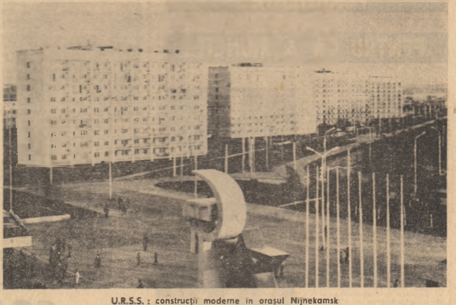
U.R.S.S.: construcții moderne în orașul Nijnekamsk

Prin însoțirea ministrului Afacerilor externe, Masayoshi Ohira și un grup numeros de experți. În cursul acestei vizite, prima după al doilea război mondial, a unu premier japonez în China — Tanaka va avea întrevederi cu premierul Ciu En-lai și cu alți conducători chinezi.