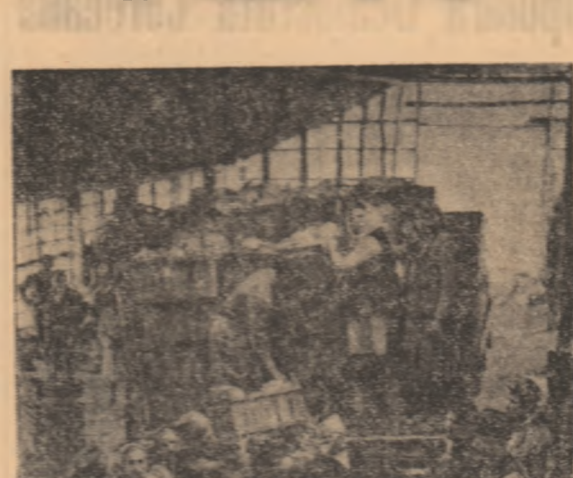
La prima unitate, la Găiseni, un autocamion tocmai pleacă cu marți spre București: 1.500 kilograme ardei gras, 100 kilograme vinete și 500 kilograme de roși.

GĂISENI: A plouat și aici, dar oamenii, atașați intereselor obștii, n-au stat cu minile în sin