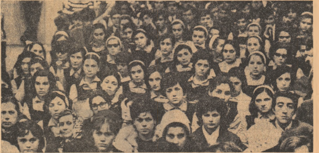
Pagina realizata de TRAIAN GINIU