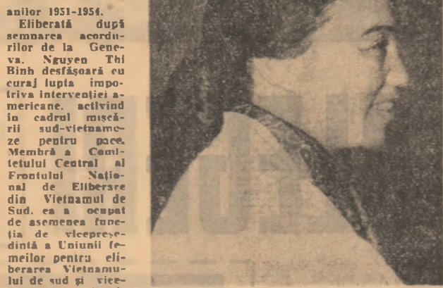
Este ministrul afacerilor externe al G.R.P.V. la Conferința de la Paris în problema vietnameză.