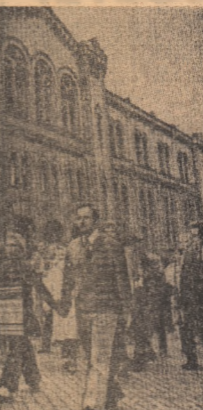
NORVEGIA. — Demonstrație la Oslo împotriva aderării țării la Piața comună.