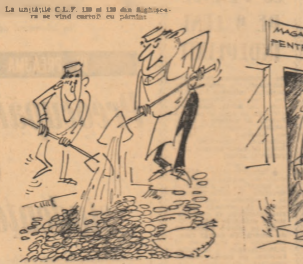
Geoparii bunel deservite. Desene de ȘT. COCIOARA

Normalitatea din domeniul comerțului nu are nici un dușman în privința calității produselor și a existenței cu care trebuie să fie însoțite. Dăruind înțelegere în momentul în care organizația responsabilă, Centrul de legume și fructe și distribuitorul C.L.F. însoțit săvîrșeze