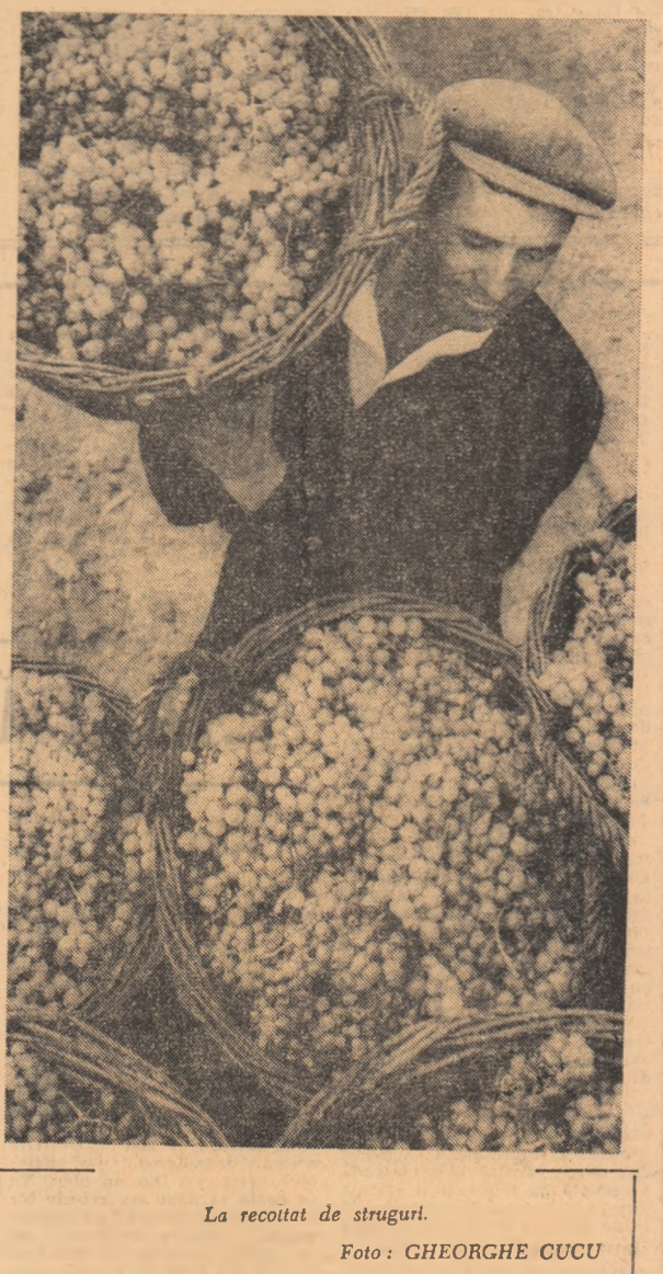
La recolta de struguri.

MARIAN OVIDIU (Continuare în pag. a V-a)