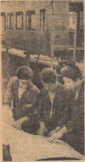
Studiu atent al proiectului, o garanție a realizării lui la cotele înalte ale calității