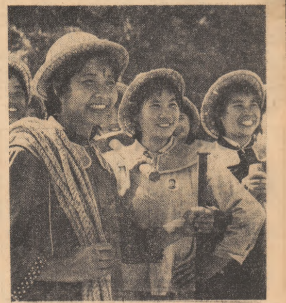
Însemnări de EUGEN FLORESCU

este apa vie a învățămîntului chinez de toate gradele. Universitatea însăși are 60 ateliere-fabrici (într-unul din ateliere studenții produc autocamioane). Studenții și profesorii ai acestui mare lăcaș de învățămînt sînt autorii proiectului celei mai mari săli din Pekin, cu 10 000 de locuri. Tot ei și-au proiectat și amenajat grădina universității, de 200 hectare.