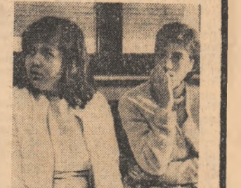
Așa m-a învățat tata... Sumarele dialoguri au avut loc recent la Oficiul de repartizare a forțelor de muncă al sectorului 8.

— Cînd aude, parcă ar fi primit două palme pe fața proaspăt cremuită. — Eu, la ceapă și cartofi? — Dacă nu vrei, alegeți singură un post de pe această listă, o invită funcționarii Oficiului prezentîndu-i un tabel. — Trucul se prinde. Fata știe carte. — De ce ascunzi că ai, totuși, școală?