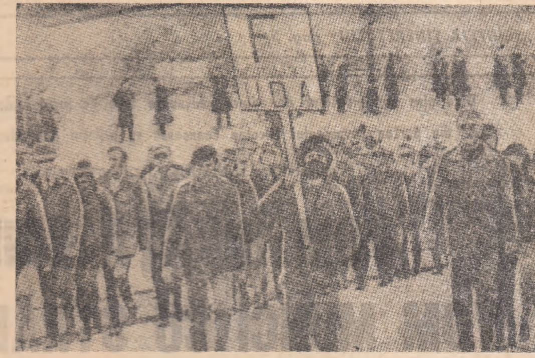
În Irlanda de nord se menține tensiunea. Forțele extremiste încearcă să împiedice o soluție pașnică. În fotografie: demonstrația unei grupări protestante la Belfast.

În cursul întrevederii, a fost efectuat un tur de orizont asupra situației mondiale actuale și a fost examinat rolul O.N.U. în cadrul evoluțiilor înregistrate în