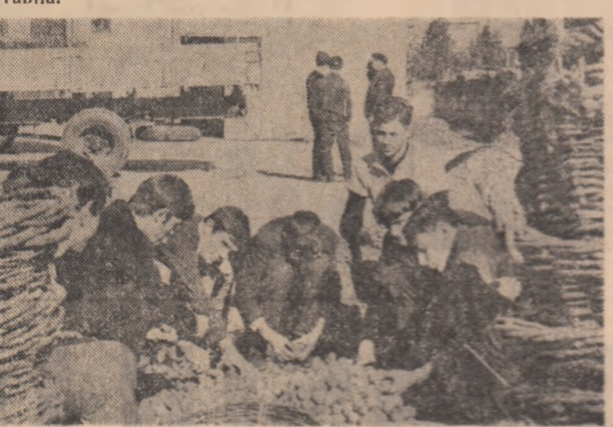
Acum, băieții care muncesc la C.L.F. Vaslui au toate condițiile materiale pentru a lucra în bune condiții. Dar, cum se poate observa în planul al doilea și fotografia, muncitorii, tot cu mișcările uitate în buznare.

În ultimele zile — foarte bune pentru lucrările agricole, și în special pentru recoltarea, transportul și depozitarea bucatelor — am întreprins un raid de campanie prin cîteva puncte de lucru din județul Vaslui. Și aici, ca peste tot, băția recoltei înseamnă acum, în aceste zile limpezi, fără ploaie, băția cu timpul.