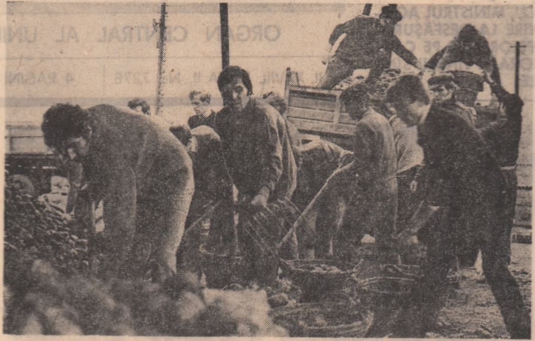
Amplă desfășurare de forțe

cord: au fost recoltate 16 hectare de sfeclă și încarcate în vagoane 250 tone. 1.000 de elevi ai Grupului școlar de chimie din orașul Victoria au lucrat pe întinsele tarlale din zona Făgărașului la cooperativele agricole din Hîrșeni, Ucea de Sus, Ucea de Jos, Vîghea de Jos. Elevii Grupului școlar al Uzinei Electroprețelărie din orașul Săcele au primit să recolteze în această toamnă o suprafață de 3.500 hectare însoțită de 3.500 hectare însoțită de 3.500 hectare în fiecare dimineață, brigada tineretului intrînd în căruța și tractat în revistă rezultatele obținute, a rîndind sarcinile pe le mai au de îndeplinit. S-a lucrat și la lumina, rezultînd de fiecare dată 200 hectare de pe o suprafață de 200 hectare. La acest succes remarcabil al tinerilor din Săcele a contribuit ajutorul substanțial primit din partea președinției cooperativei agricole, a comitetului de tineret și a muncitorilor cooperativelor agricole din zona Făgărașului și unelte necesare recoltării.